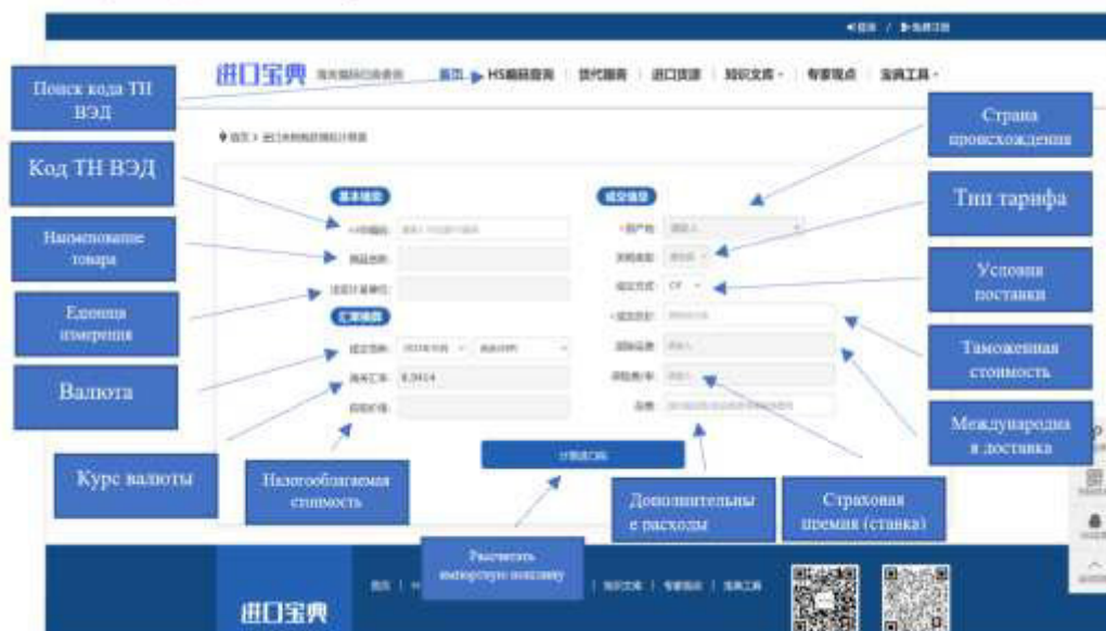
Рисунок 2 – Пример сайта, который используется для определения ставок таможенных пошлин и налогов в соответствии с кодом ТН ВЭД 12

При импорте иностранных товаров в Китай предприятия обязаны выплачивать различные таможенные платежи, включая пошлины, акцизы и налог на добавленную стоимость.