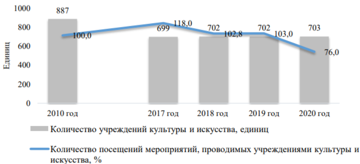
Рисунок 1 – Количество учреждений культуры и искусства и количество посещений мероприятий, проводимых учреждениями культуры и искусства

Количество учреждений культуры и искусства и количество посещений мероприятий, проводимых учреждениями культуры и искусства представлены на рисунке 1.