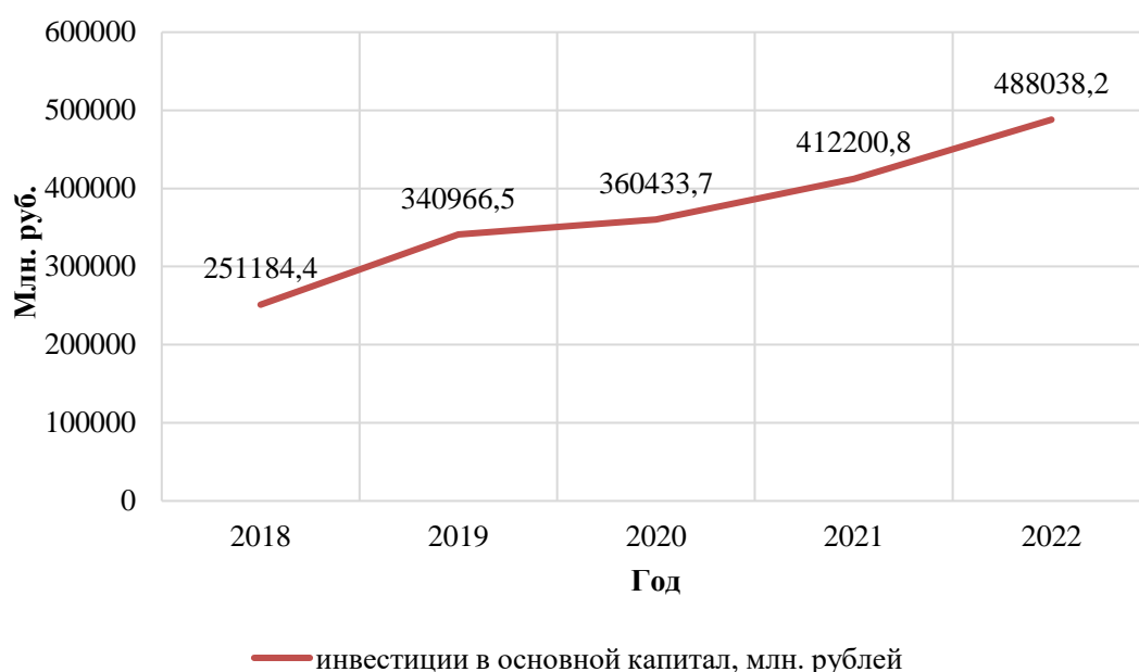
Рисунок 2– Динамика инвестиций в основной капитал Амурской области

Инвестиции в основной капитал представляют собой совокупность затрат, направленных на воспроизводство основных средств (новое строительство, расширение, а также реконструкция и модернизация объектов, которые приводят к увеличению их первоначальной стоимости, приобретение машин, оборудования, транспортных средств, на формирование основного стада, многолетние насаждения и т.д.). Начиная с 2001 года, инвестиции в основной капитал учитываются без налога на добавленную стоимость.