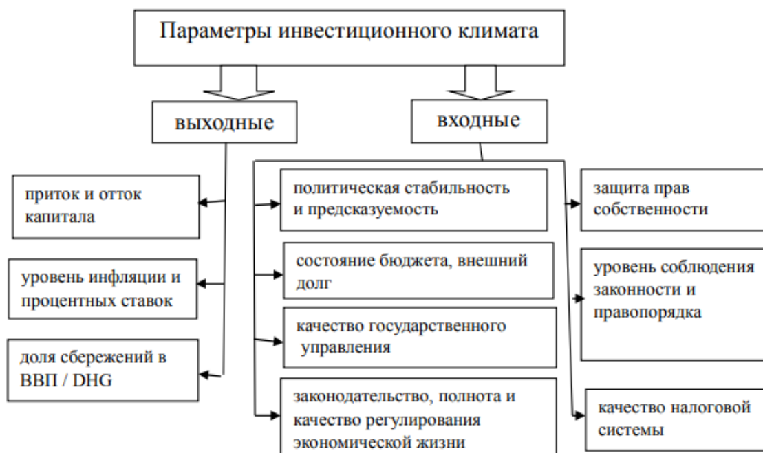
Рисунок 1 – Параметры инвестиционного климата страны

Для анализа инвестиционного климата используются методики, выбор которых зависит от целей и задач исследования, а также от характеристик объекта анализа. Как правило, оценка инвестиционного климата проводится на основе анализа факторов, определяющих его состояние и влияющих на экономический рост. В ходе анализа рассматриваются как выходные, так и входные параметры инвестиционного климата в стране 6 (рис. 1).