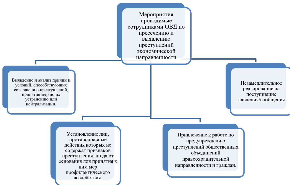
Рисунок 1 – Мероприятия по пресечению и выявлению преступлений экономической направленности

В ходе исследования в результате обобщения изученной информации была составлена схема мероприятий, проводимых сотрудниками ОВД по пресечению и выявлению преступлений экономической направленности, представленная на рисунке 1.