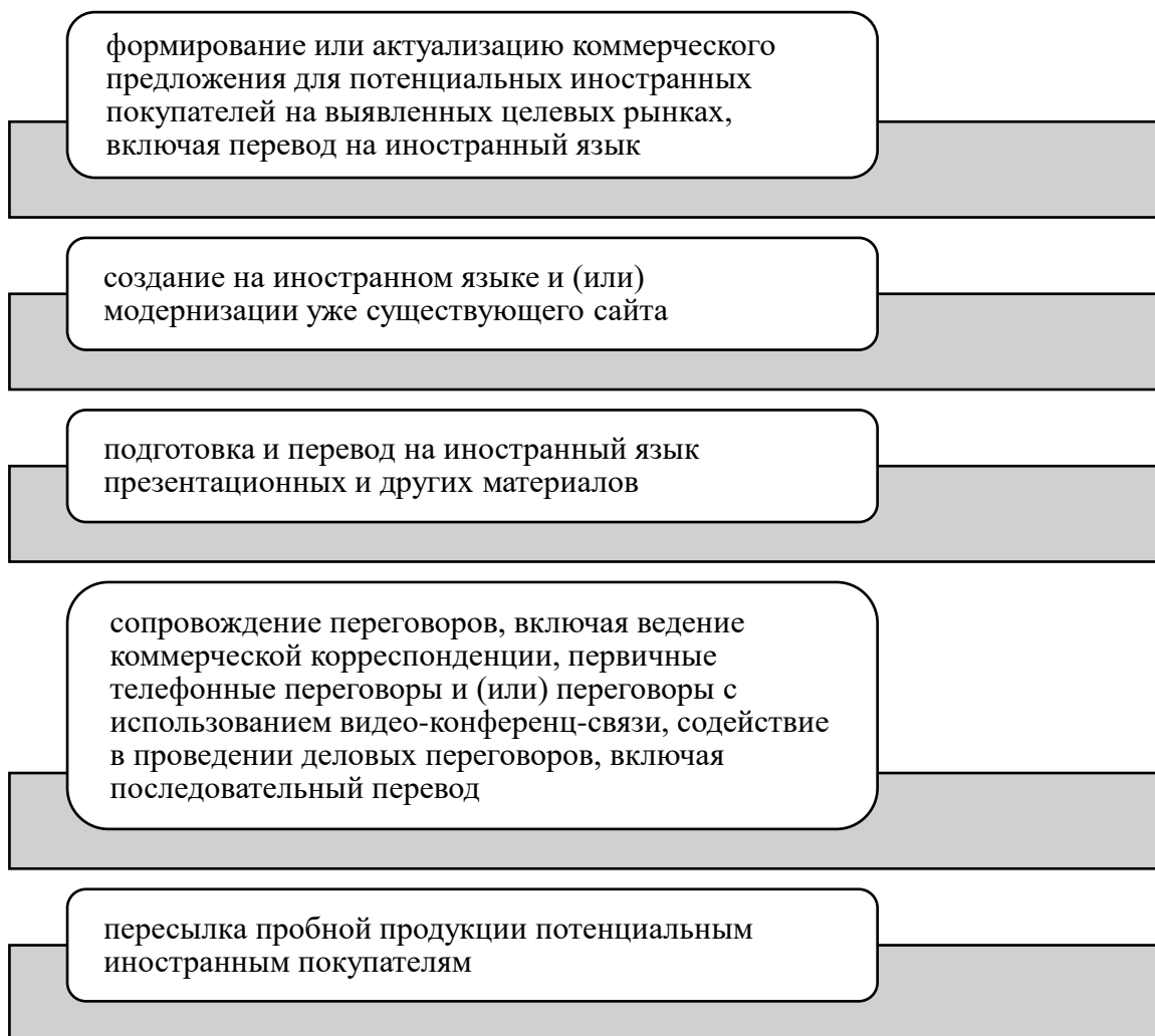
Рисунок 4 – Услуги Центр поддержки экспорта в рамках поиска и подбора иностранного покупателя

Стоит отметить, что затрат на реализацию данного мероприятия не требуется, так как все услуги, оказываемые Центром поддержки экспорта, осуществляются бесплатно.