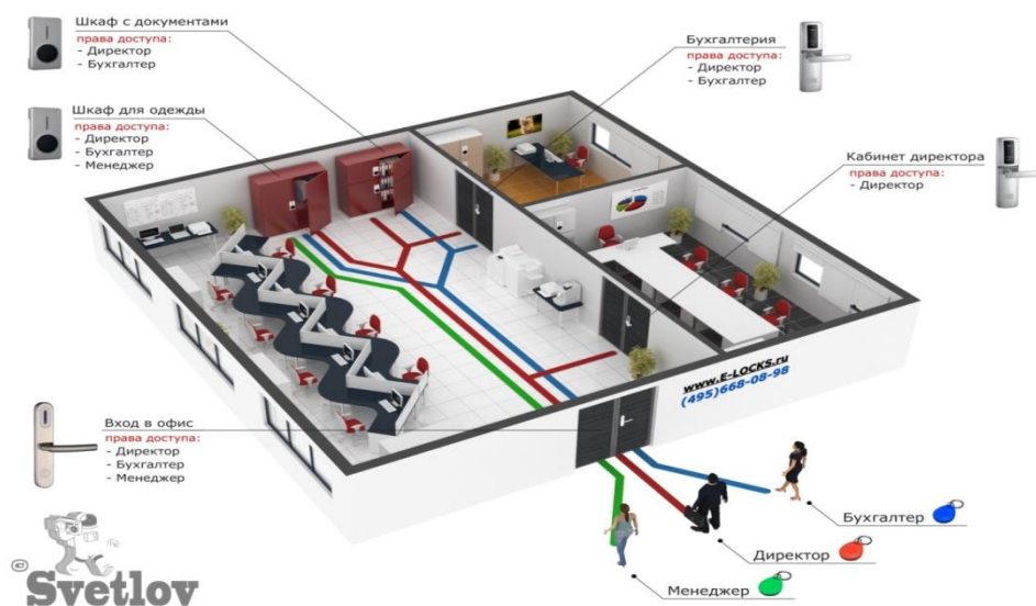
Рисунок 8 – Пример зонирования помещений в ParsecNET

Выполнение этих операций на реальном технологическом предприятии требует набора оборудования и приборов, которые служат платформой для этих задач. ParsecNet является одной из таких платформ управления. Ее можно назвать инфраструктурой для всех стратегий управления, начиная с самых простых и заканчивая продвинутыми системами управления.