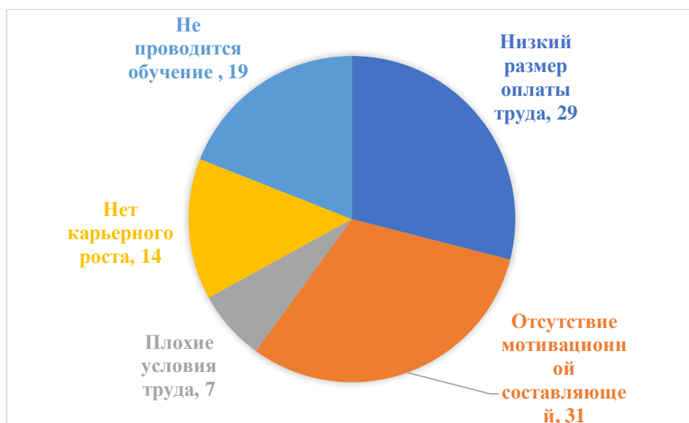
Рисунок 8 – Результат опроса сотрудников ООО «УникОпт» о возможных причинах увольнения

Так, в результате опроса, 60 % респондентов отметили низкий уровень оплаты труда, а также отсутствие мотивационной составляющей. Стоит отметить, что менеджерам по продажам не выплачиваются премии за перевыполнение плана, что может негативно сказаться на уровне объема продаж. А уровень средней заработной платы, который составляет меньшую величину от среднестатистической по Амурской области 46510 руб. против 72994 руб., может негативно отразиться на результатах деятельности и других сотрудников.