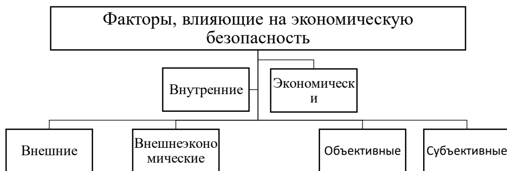
Рисунок 4 – Факторы, влияющие на уровень экономической безопасности предприятия 4

Факторы, влияющие на уровень экономической безопасности предприятия, представлены выше.