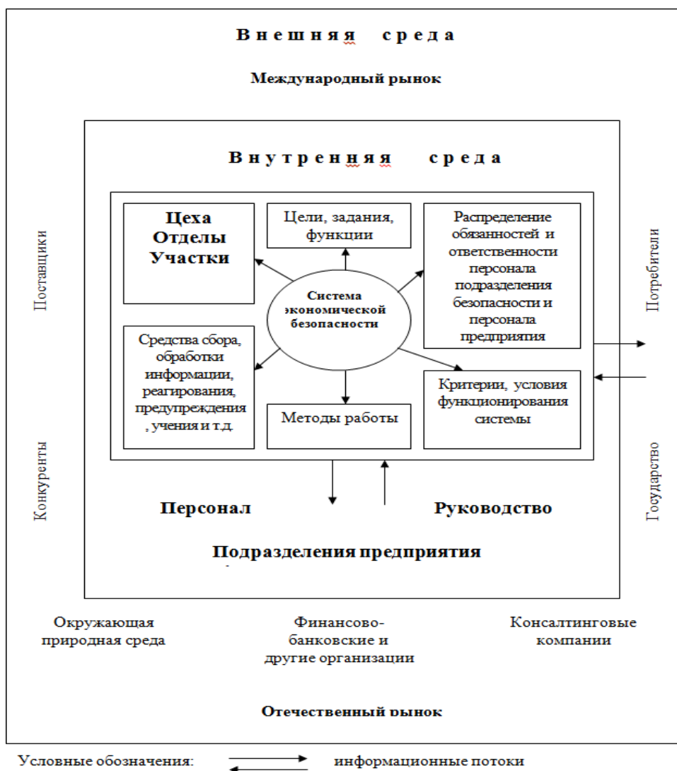
Рисунок 3 – Взаимосвязь системы экономической безопасности предприятия с его внешней и внутренней средой

Предприятие, в процессе своей хозяйственной деятельности непосредственно взаимодействует с внешней средой, некоторые элементы которой могут выступать потенциально опасными для экономической безопасности предприятия.