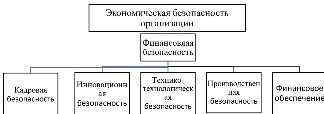
Рисунок 1 – Схема обеспечения экономической безопасности посредством обеспечения финансовой безопасности (финансового обеспечения)

На практике наиболее точно можно определить уровень экономической безопасности объекта через его финансовое состояние. Именно через финансовые потоки достигается процесс обеспечения экономической безопасности. Представим схему обеспечения экономической безопасности посредством финансовой безопасности на рисунке.