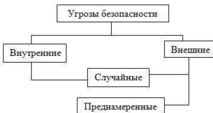
Рисунок 5 – Классификация угроз по факторам и мотивации

Классификация угроз безопасности может быть реализована разделением на угрозы связанные с внутренними и внешними факторами.