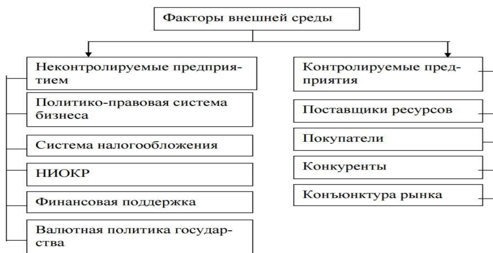
Рисунок 6 – Факторы угроз внешней среды

Внешнюю среду следует рассматривать как совокупность факторов, находящихся за пределами сферы влияния предприятия, характеризующихся высоким уровнем неопределенности, отсутствием общепринятой системы диагностики ее состояния и прогноза развития. Классификация факторов внешней среды позволяет разделить их на главные и второстепенные, объективные субъективные, контролируемые и неконтролируемые, реально существующие и потенциальные, управляемые и неуправляемые, случайные и детерминированные.