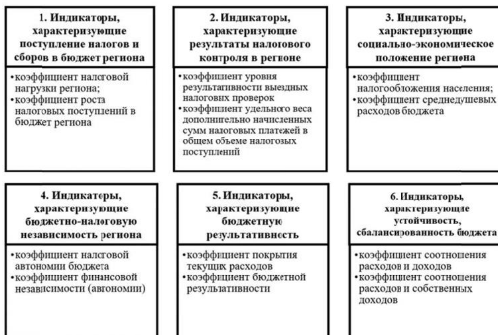
Рисунок 3 – Индикаторы бюджетно-налоговой безопасности региона

Для исследования бюджетно-налоговой безопасности региона был разработан набор индикаторов, состоящий из шести групп по два показателя в каждой группе (рисунок 3). 14