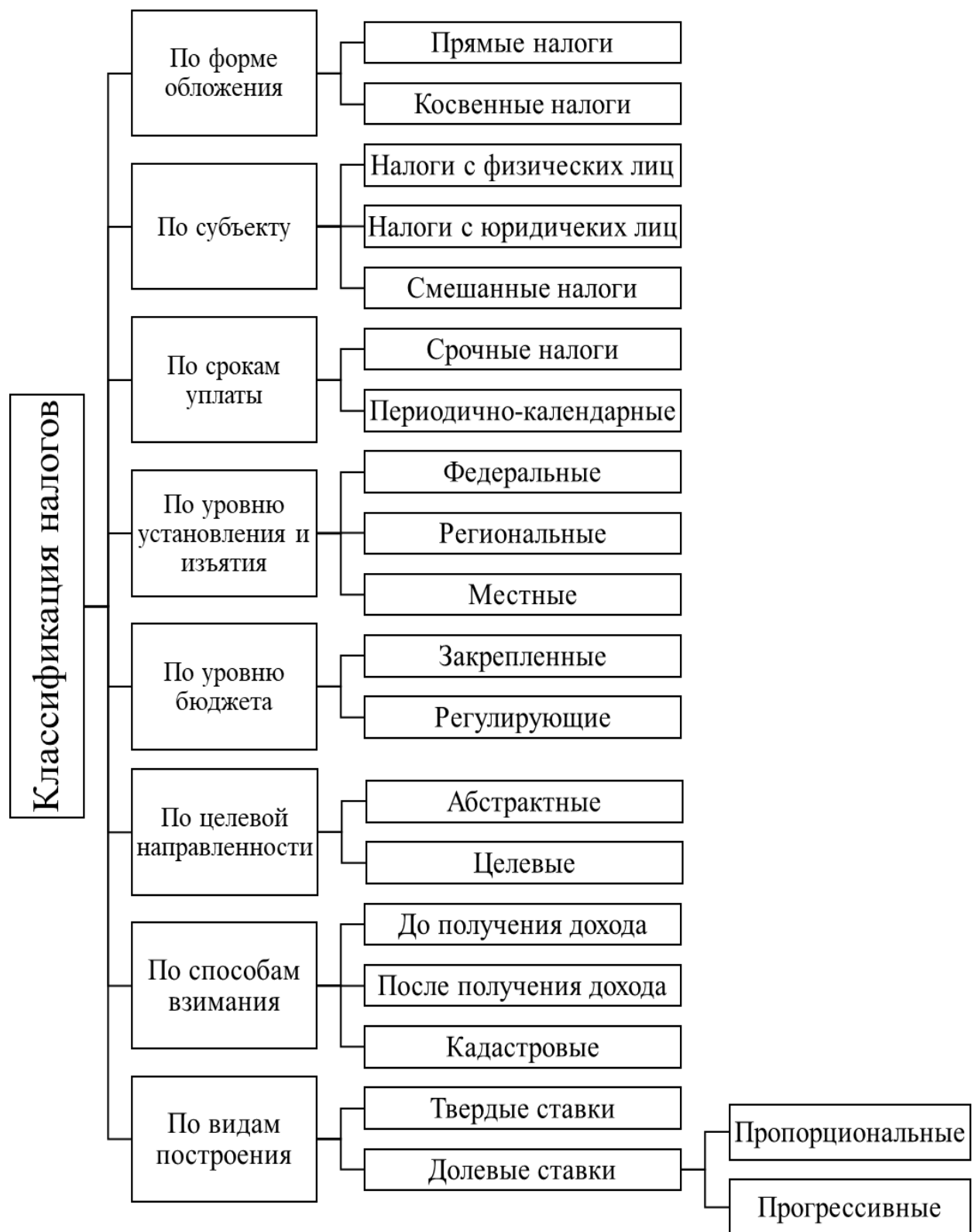
Рисунок 1 – Классификация налогов и сборов

Региональная экономическая безопасность охватывает различные взаимосвязанные структурные элементы, включая: внешнеторговую безопасность (за-