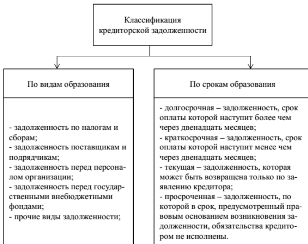
Рисунок 1 – Классификация кредиторской задолженности

ности. Так, первоочередными являются платежи, связанные с оплатой налогов и сборов, учитывая штрафные санкции, которые накладывают контролирующие органы в случае несвоевременной оплаты.