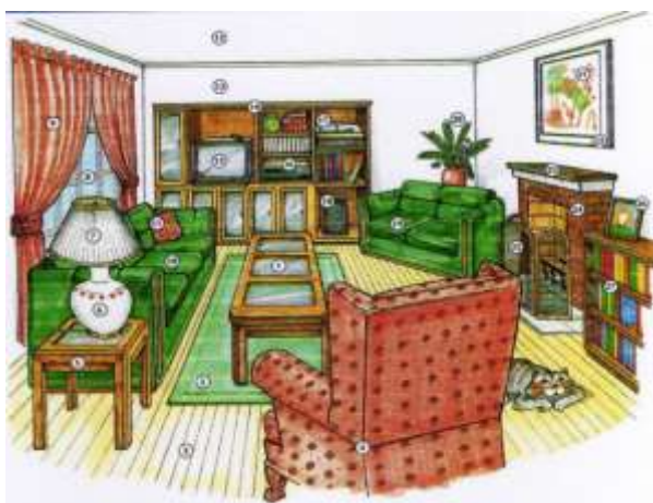
Рисунок 1 – Пример картинки помещения

Пример: Bist du unter dem Sofa? Bist du hinter dem Stuhl? Bist du auf dem Tisch? Bist du zwischen dem Kamin und dem Sessel?