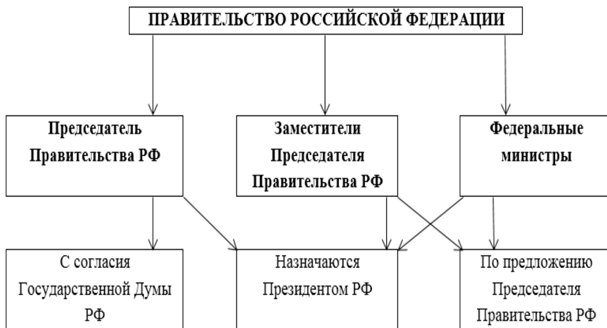
Рисунок 1 - Структура Правительства РФ

орган системы исполнительной власти Российской Федерации. В состав Правительства Российской Федерации входят премьер-министр, заместители председателя правительства и федеральные министры (рисунок 1) 11 .