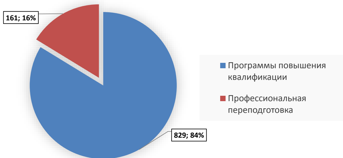
Рисунок 2 – Количество слушателей за 2019 год

На 2019 год, образовательными услугами факультета дополнительного образования воспользовались 990 человек. Из них по программе повышения квалификации прошло 829 человек. В рамках профессиональной переподготовки было 161 слушатель. Все это наглядно представлено на рисунке № 2.