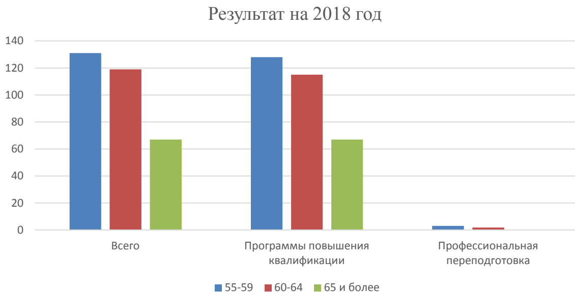
Рисунок 4 – Количество слушателей по возрасту за 2018 год

На 2018 год граждан 55-59 лет намного больше чем 60-64 и 65 и более лет. Чаще всего граждане 55-59 лет заинтересованы в программах повышения квалификации, также, как и граждане остальных возрастных категорий.