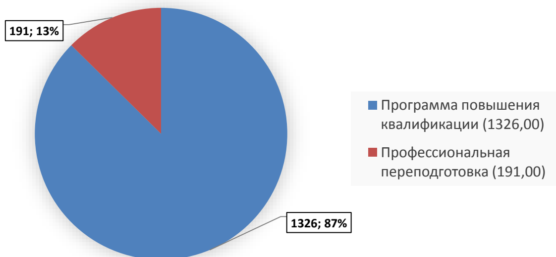
Рисунок 1 – Количество слушателей за 2018 год

На факультете дополнительного образования, на 2018 год, было 1517 слушателей образовательных программ. Из них 1326 прошли программы повышения квалификации, 191 человек прошли профессиональную переподготовку. Наглядно это представлено на рисунке № 1.