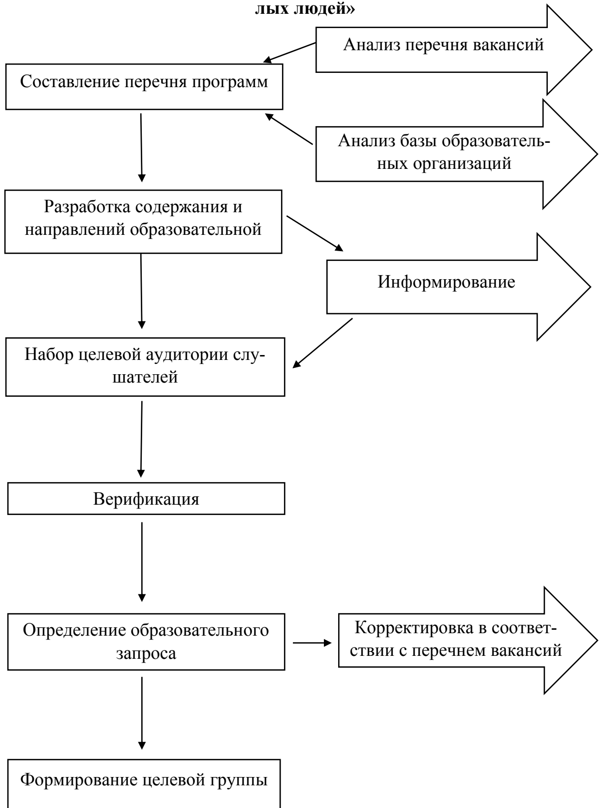
Рисунок В1 – Модель дополнительного образования пожилых людей