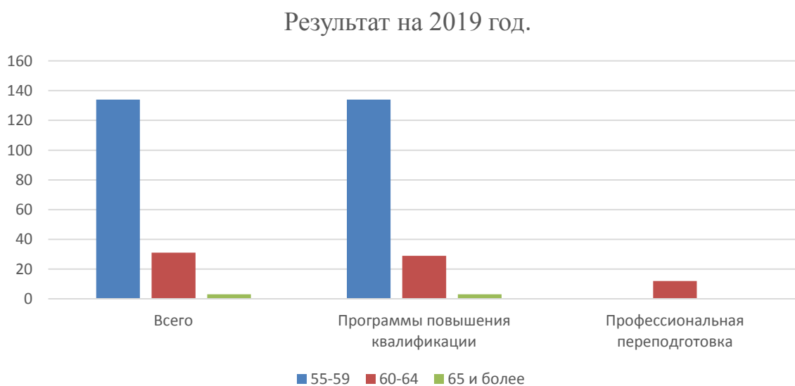
Рисунок 5 – Количество слушателей по возрасту за 2019 год

На 2019 год, граждан, заинтересованных в получении дополнительного образования меньше чем в 2018 году, из них преимущественно выбирают программы повышения квалификации. В рамках профессиональной переподготовки, свое предпочтение показала категория граждан от 60-64 лет.