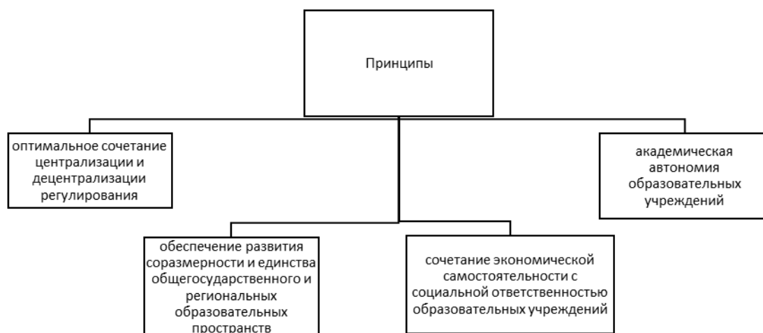
Рисунок 2 – Принципы необходимые при отработке механизма государственного регулирования сферы образования

Во время отработки механизма государственного регулирования сферы образования необходимо учитывать ряд минимально необходимых принципов, изображенных на рисунке 2 9 .