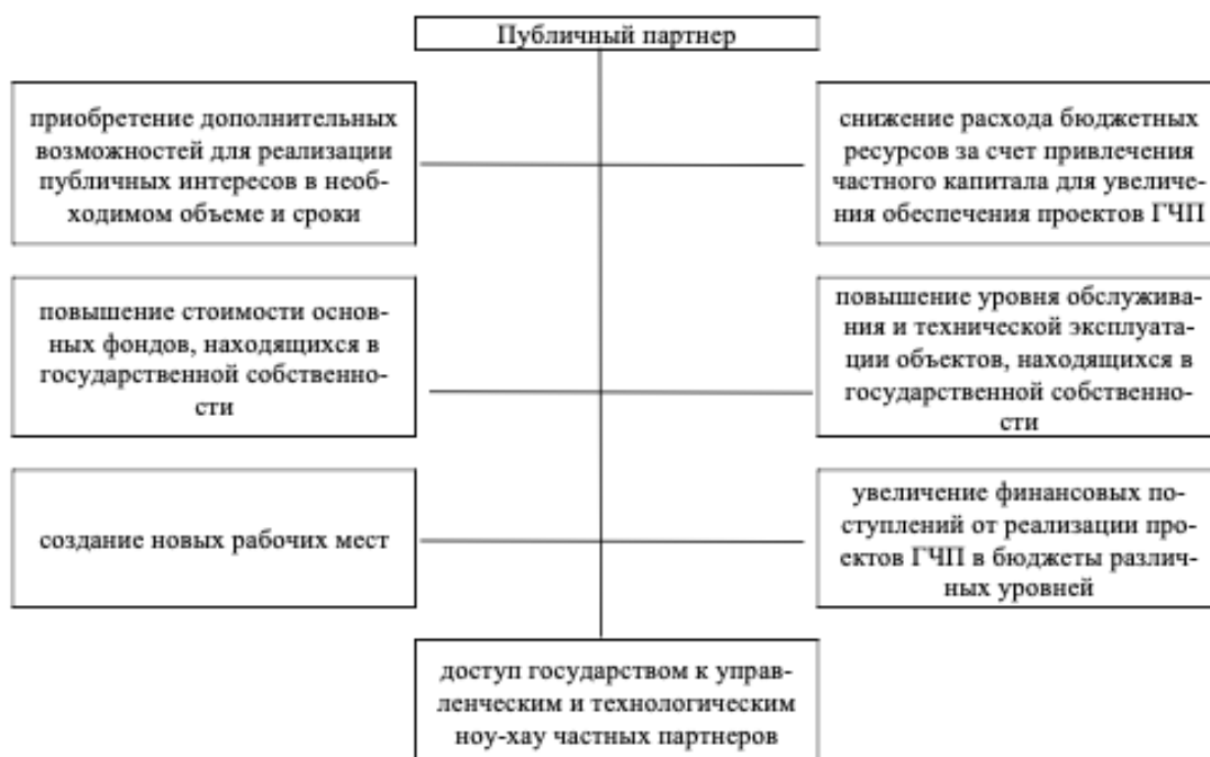
Рисунок 1 – Интерес публичного партнера к формированию ГЧП

Возникающие при реализации инфраструктурных проектов риски, экономическими методами нивелируются субъектами государственной власти и управляются ими. А риски, нивелирующиеся субъектами частного бизнеса, управляются частными партнёрами. ГЧП основано на принципе согласия двух сторон, при не обязательном полном совпадении целей партнеров. Достаточно их взаимосогласованные решения по достижению необходимых результатов с целью эффективной реализации проекта. Партнёры обоюдно отвечают за реализацию проекта, subsidiарно отвечая за возложенные на них функции в рамках проекта 15 . Публичный партнер имеет интерес к формированию отношений ГЧП в следующих положениях, которые представлены в рисунке 1.