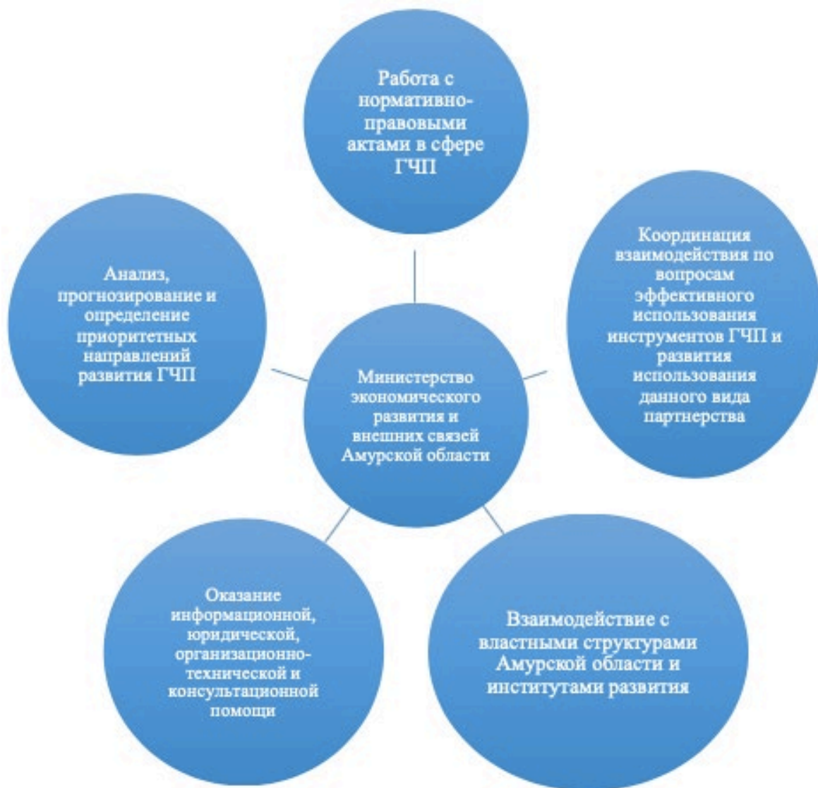
Рисунок 3 – Основные направления деятельности Министерства экономического развития и внешних связей Амурской области по развитию ГЧП

Как можно заметить: развитие нормативных и процессуальных инструментов государственно-частного партнерства привело к подъему роста проектов основанных на ГЧП и МЧП, в форме концессионных соглашений. По мимо этого, также информационная поддержка в сфере ГЧП со стороны Министерства экономического развития и внешних связей Амурской области оказывает положительное влияние на рост данных проектов, информация на портале обновляется регулярно, там же представлен перечень всех объектов ГЧП по Амур-