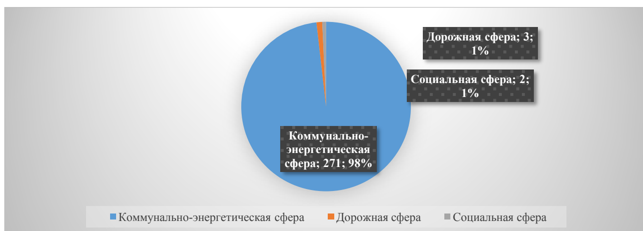
Рисунок 4 – Распределение реализуемых проектов ГЧП в Амурской области

Но так как более актуальных данных (за 2019 год) по другим регионам определить не возможно делать вывод о том, что Амурская область является лидером нельзя. Поэтому проведем анализ реализуемых проектов ГЧП Амурской области за 2019 год по внутренним критериям.