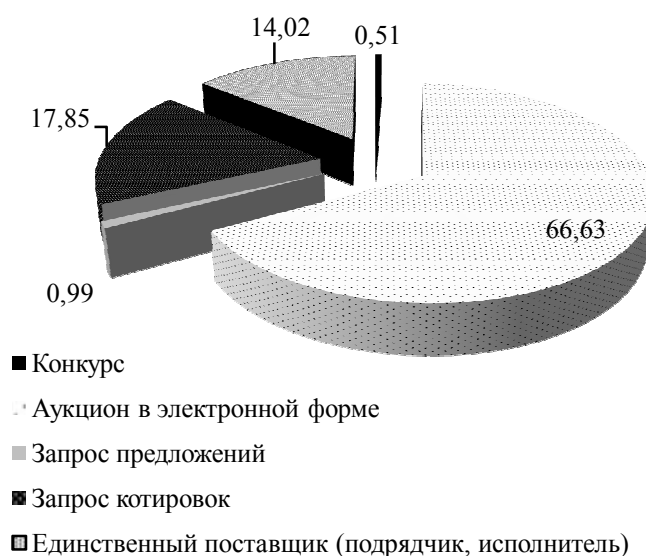
Рисунок 5 – Структура планируемого объема инвестирования государственных закупок на территории Амурской области за 2016 – 2018 гг.

Графическое изображение структуры планируемого объема инвестирования государственных закупок на территории Амурской области за 2016 – 2018 гг. представлено на рисунке 5.