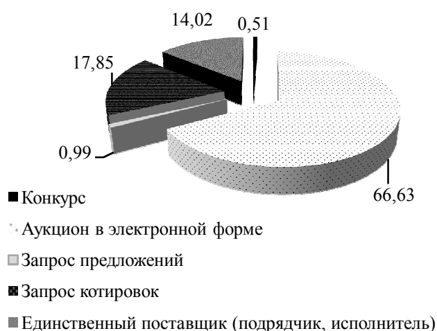
Рисунок 4 – Структура извещений о проведении государственных закупок на территории Амурской области за 2016 – 2018 гг.

Графическое изображение структуры извещений о проведении государственных закупок на территории Амурской области за 2016 – 2018 гг. представлено на рисунке 4.