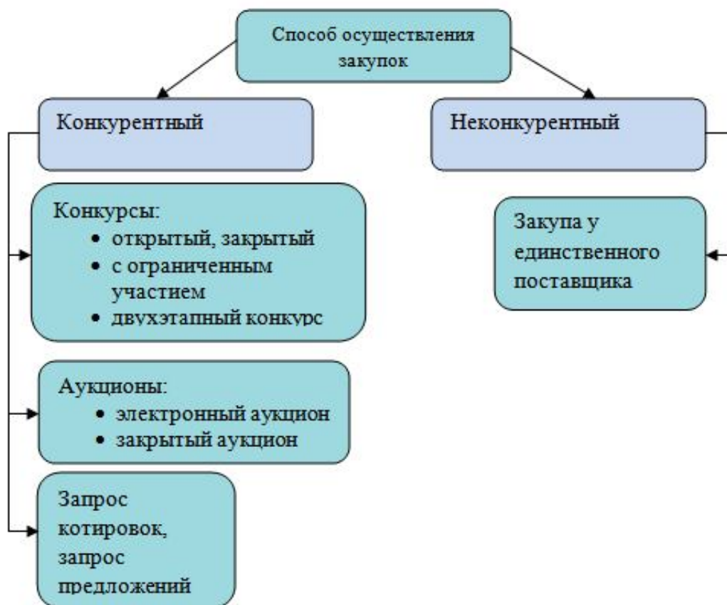
Рисунок 2 – Способы определения поставщиков

На основании п. 2 ст. 3 Федерального закона (далее – Закон № 44) определение поставщика (подрядчика, исполнителя) - это совокупность действий, которые осуществляются заказчиками в порядке, установленном данным Законом, начиная с размещения извещения об осуществлении закупки товара, работы, услуги для обеспечения государственных нужд (федеральных нужд, нужд субъекта РФ) или муниципальных нужд либо в установленных данным Законом случаях с направления приглашения принять участие в определении поставщика (подрядчика, исполнителя) и завершаются заключением контракта. 12