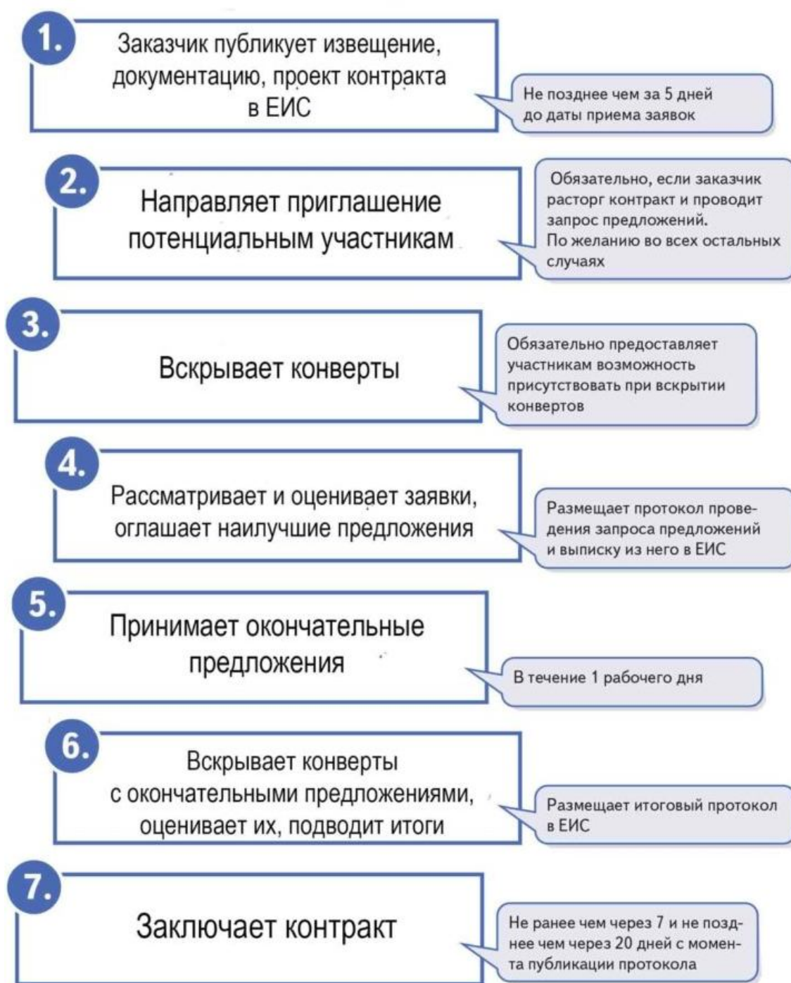
Рисунок А.1 - Общая схема проведения государственных закупок в форме запроса предложений