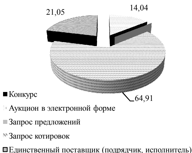
Рисунок 6 - Структура извещений о проведении госзакупок в Дирекции по обслуживанию и содержанию административных зданий Правительства Амурской области за 2016 – 2018 гг.

Структура извещений о проведении госзакупок в Дирекции по обслуживанию и содержанию административных зданий Правительства Амурской области за 2016 – 2018 гг. представлена на рисунке 6.