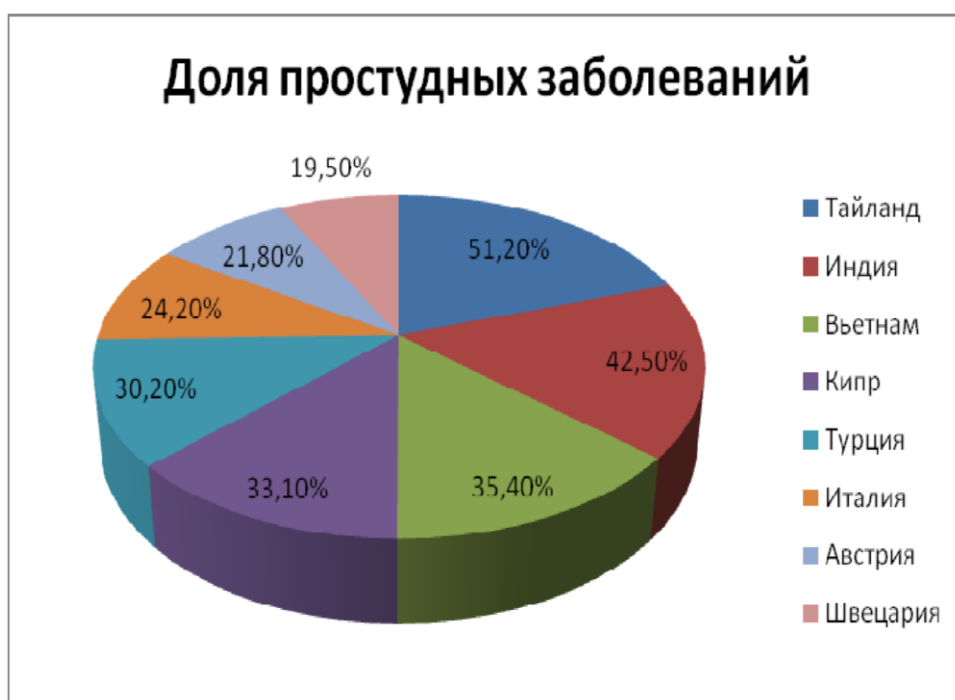
Рисунок 4 - Доля простудных заболеваний по странам

Европейские страны. Доля таких страховых случаев в Италии – 24,2%, Австрии – 21,8%, Швейцарии – 19,5%.