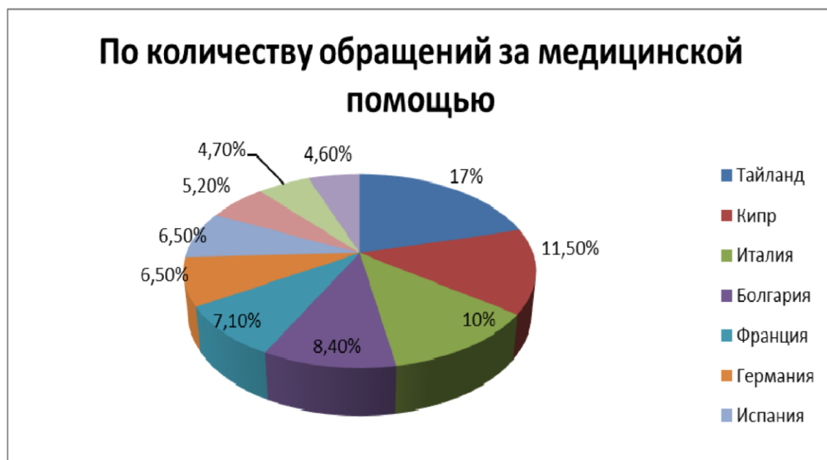
Рисунок 3 - Объем страховых случаев по странам

Страны, на которые приходится большее количество страховых случаев, приведены на рисунке 3.