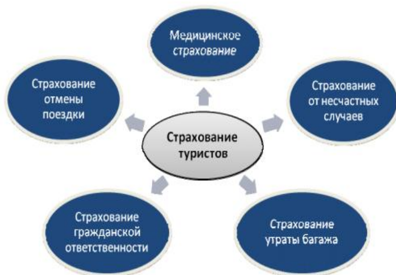
Рисунок 2 - Виды рисков страхования, выезжающих за рубеж

В аналогичных условиях страховщикам необходимо регулярно изучать сложившуюся обстановку, имеющиеся статистические данные за прошедшие периоды с целью спрогнозировать вероятный объем страховых случаев, а также величину возможных убытков, для того чтобы создать необходимые для возмещения страховые запасы. Следовательно, на данный момент страхователи имеют все шансы уберечь себя практически от всех неожиданных ситуаций. Рис. 2 иллюстрирует различные виды рисков, которые покрывает страхование путешественников в РФ.