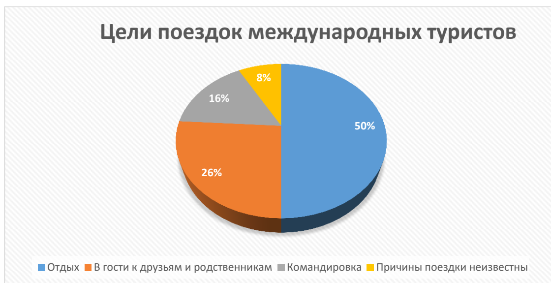
Рисунок 1 – Цели поездок международных туристов

Так или иначе, в туризме можно выделить 3 основные цели – это отдых, поездка к знакомым, родственникам, а также командировки. Об этом нам сообщают сведения информационного туристического портала Kontinent.