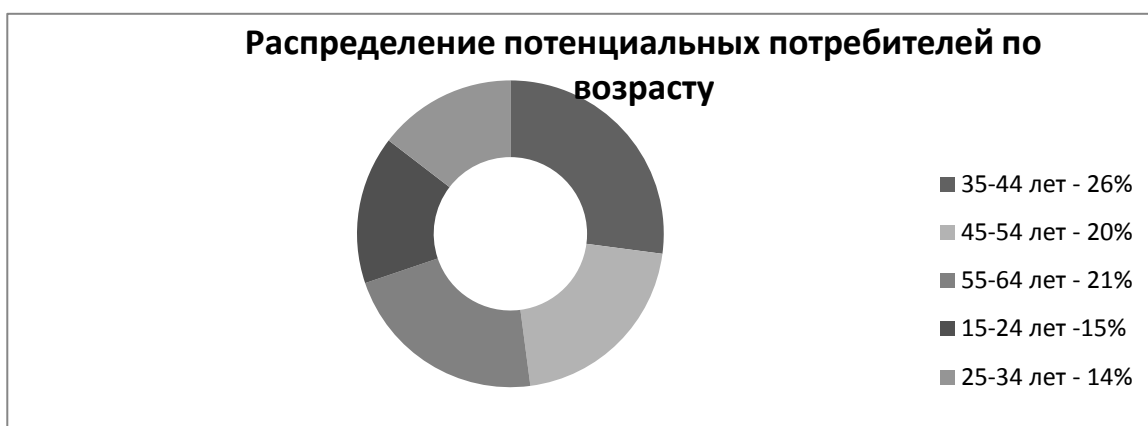
Рисунок 2 - Распределение потенциальных потребителей по возрасту

Малое количество в категории от 15 до 24 лет и 25-34 лет определяется по причине, что молодые люди проводят рыболовный тур с родителями или же недостаточно зарабатывают для подобного вида досуга.