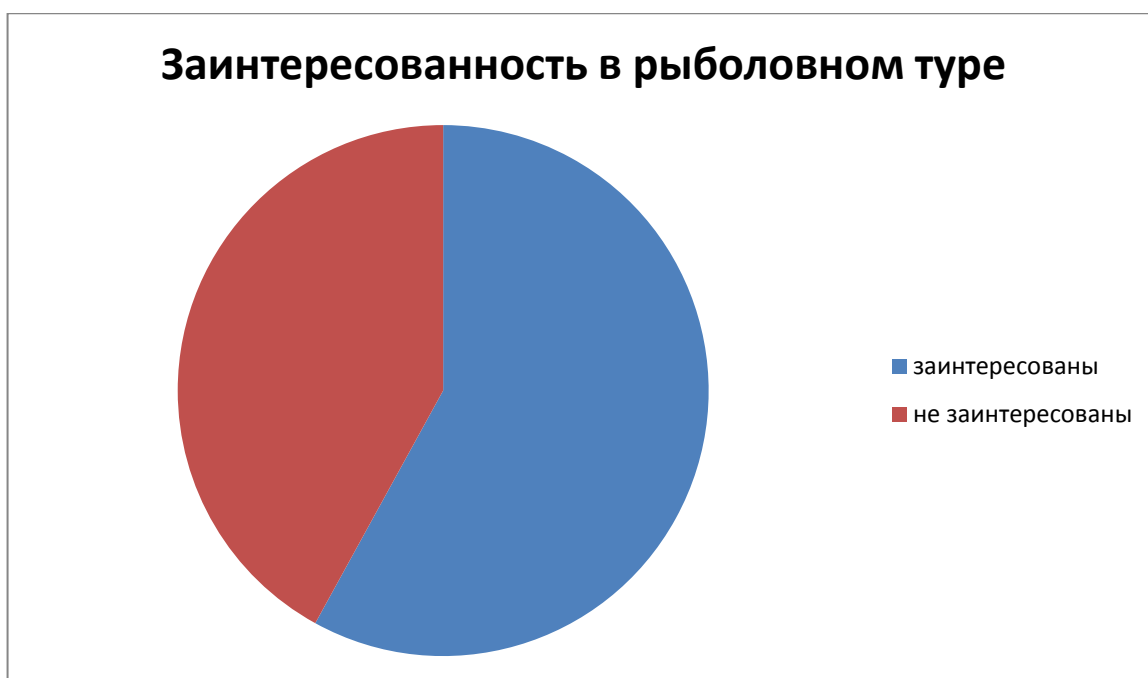
Рисунок 5 - Заинтересованность в рыболовном туре

По результатам данного опроса можно сделать вывод, что привлечение иностранных туристов для рыболовного тура целесообразно, уникальность подобного тура делает его привлекательным не только для российских потребителей, но и для туристов из приграничного Китая.