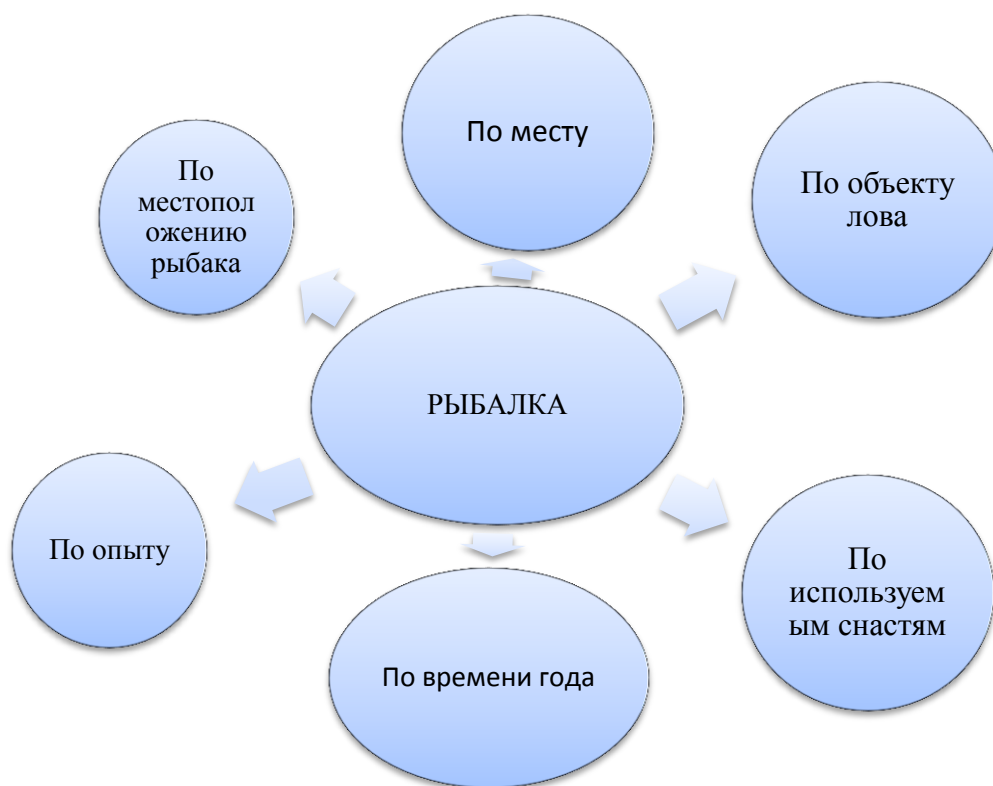
Рисунок 1 - Виды рекреационного рыболовства

Рекреационное рыболовство принято делить на множество различных видов в зависимости от факторов и особенностей.