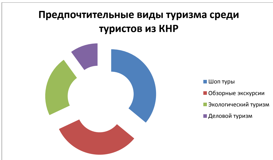
Рисунок 4 - Предпочтительные виды туризма среди туристов из КНР

Большинство респондентов отметили, что при получении положительного опыта от текущей поездки, готовы впоследствии осуществлять туры на территорию Амурской области очень часто. Что же касается продолжительности поездки, оптимальным сроком большинство опрошенных считают поездки на срок от трёх до пяти дней.