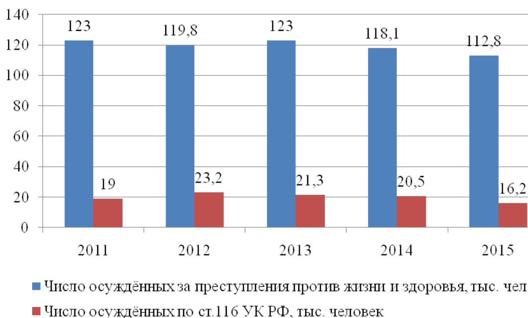
Рисунок 1 – Динамика числа осуждённых по преступлениям против жизни и здоровья и по ст.116 УК РФ «Побои»

Согласно статистическим данным, представленным в обзорах деятельности федеральных судов общей юрисдикции и мировых судей, нельзя однозначно утверждать, что в российском обществе сложилась тенденция к снижению количества уголовных дел по ст.116 УК РФ. Более того, в обществе и экспертных кругах имеются спорные взгляды относительно недавно вступивших в силу изменений в УК РФ, частично декриминализировавших данную статью. На Рисунке 1 представлена динамика осуждённых по преступлениям против жизни и здоровья и по ст.116 УК РФ «Побои» 2 .