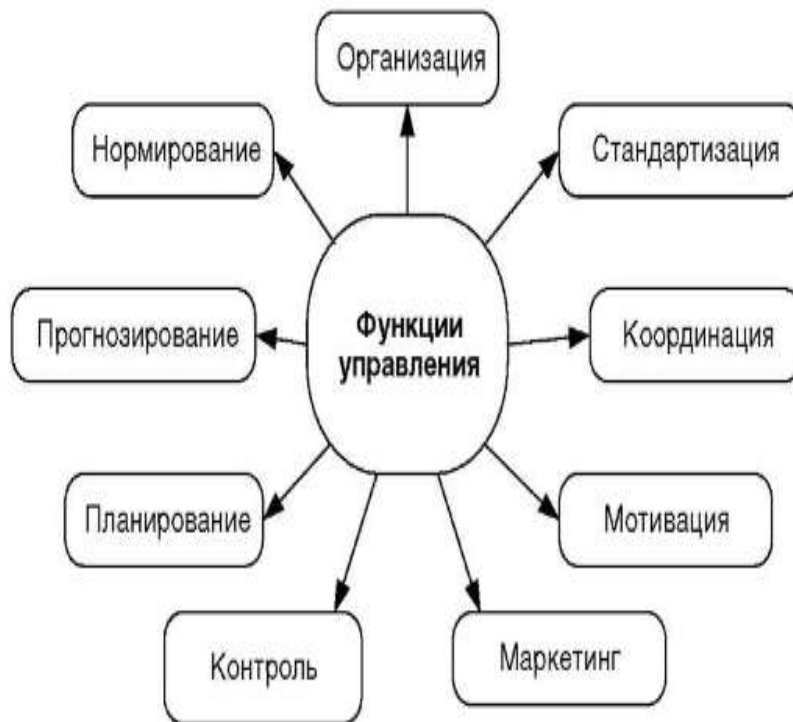
Схема организации работ в организации