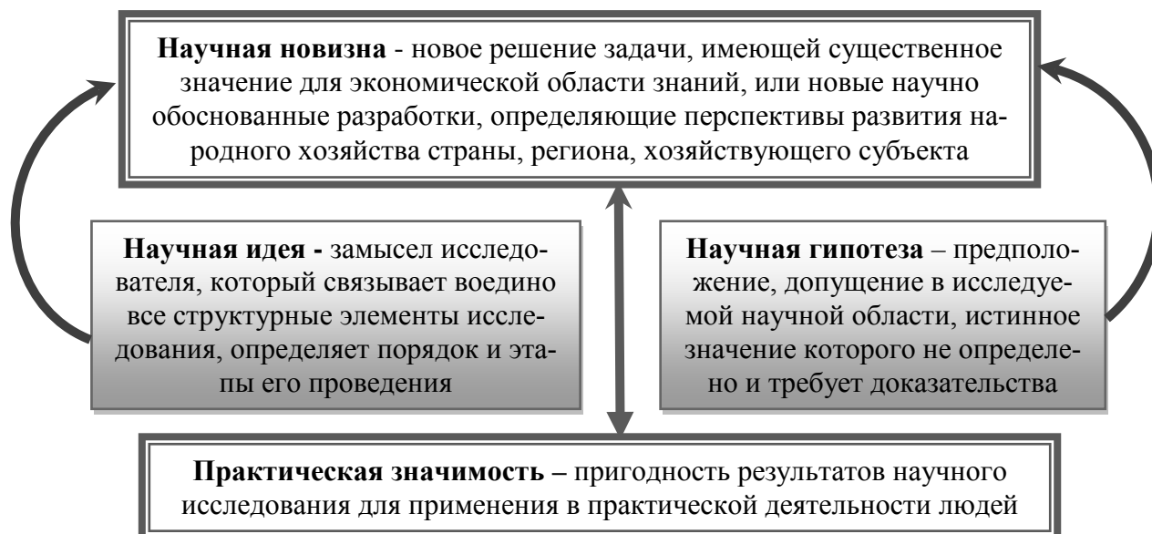
Рис. 1 Взаимосвязь элементов научного исследования

Поиск научных идей представляет собой творческий этап исследования, базирующийся на обширных теоретических и экспериментальных исследованиях, изучения действия экономических законов и закономерностей, поведения объектов исследования в конкретных рыночных условиях, анализе статистических данных. После определения научной идеи исследователь переходит к формированию научных гипотез, которые тесно связаны с научными проблемами. Гипотезы как обязательный элемент исследований, представляют собой предположения, выдвигаемые с целью объяснения причин, свойств и существования явлений и подлежащие эмпирической проверке. Любая гипотеза выполняет описательную, объяснительную, прогностическую функции, выражающуюся в прогнозировании конечных результатов экономического преобразования и долговременность их существования. Научное познание обладает следующими свойствами: