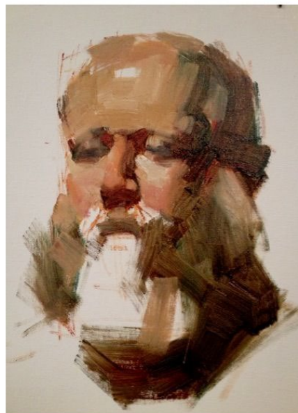
Определение больших цветотональных отношений.