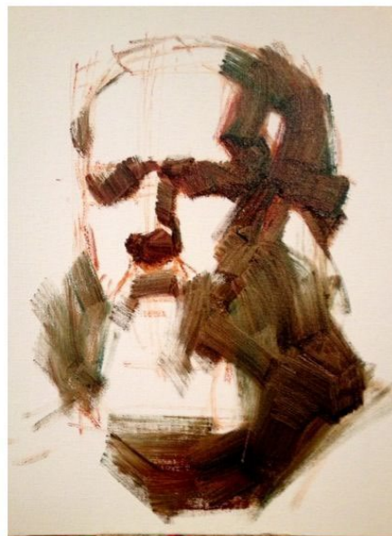
Определение светотени головы.

Во втором семестре работа со студентами идет по пути закрепления и углубления знаний, навыков и умений, полученных в течение всего периода обучения. Более углубленно трактуются портретные характеристики, пропорции, пластика, рисунок, композиция и т. д. Большое внимание уделяется характеру одежды, деталей костюма и натюрморта, а также взаимосвязи фигуры, натюрморта и окружающей среды. Немаловажное значение имеет творческое начало, умение отбирать из множества деталей главное и заострять на этом внимание.