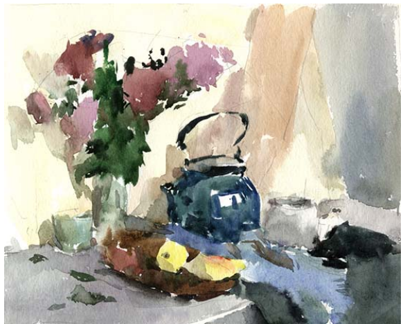
Рис. 1 Примеры быстрых, живописных фрэскизов.