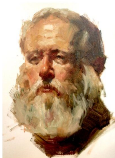
Детальная проработка больших и малых форм головы. Обобщение, завершение работы.