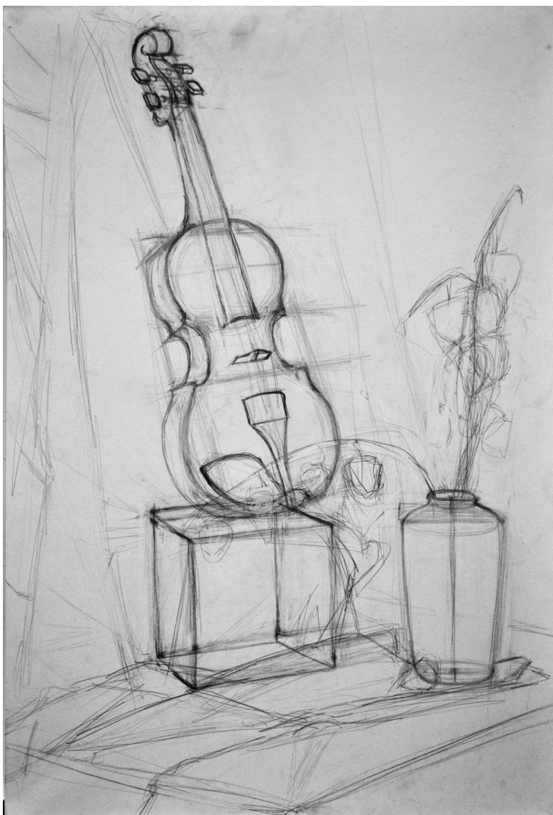
Рис. 3 подготовительный рисунок.

Рисунок составляет основу живописного изображения. Нанесенные на поверхность бумаги легкими, без нажима, линиями, рисунок устанавливает размеры, характер и форму изображаемых объектов, расположение их в пространстве. Определяются границы светотени, рисунок падающих теней, блики. Все построения ведут линиями без нажима, и предметы рисуют как бы прозрачными («сквозными»), уточняя их конструктивные особенности. Если объем предметов решается при помощи светотеневого рисунка, то на втором этапе намечают падающие и собственные тени предметов, закрывая их слегка тоном.