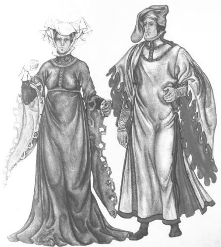
Бургундские моды XVв