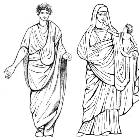
Римский Vв д.н.э - Vв н.э