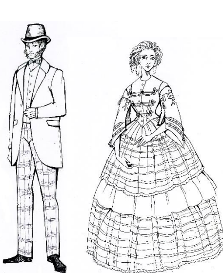
Второе рококо 1850 -1870в