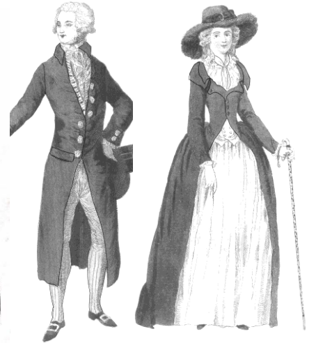
Классицизм 2-я пол. XVIIIв