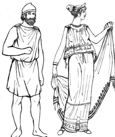
Греческий VII-IVв д.н.э