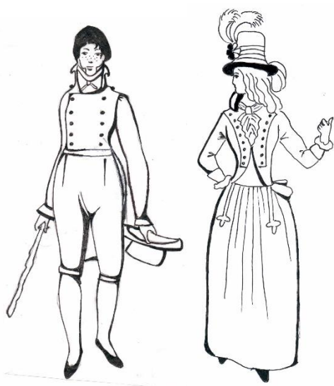
Костюм Французско революции 1789 г.