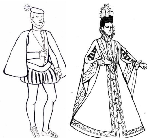
Ренессанс испанский XVIв