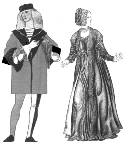
Ренессанс итальянский XVв