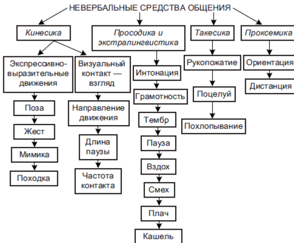
Рис. 2. Схема невербальных средств общения

К невербальным средствам общения относятся: кинесика, просодика и экстралингвистика, такесика, проксемика (рис. 2).