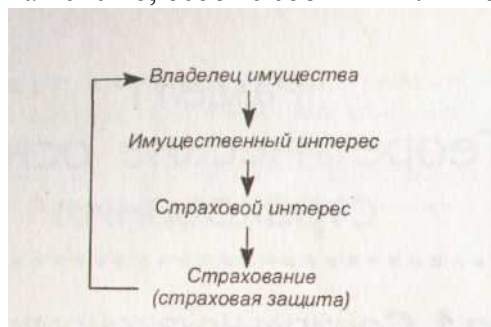
Рис. 1. Взаимосвязь понятий «владелец имущества» — «страхование»

Такой способ разумной предусмотрительности, обеспечения экономической безопасности возник еще в глубокой древности (тому есть документальные свидетельства, относящиеся к XVIII в. до н. э.). Позднее страховой защитой стал охватываться широкий круг объектов страхования: материальное обеспечение граждан в случае смерти кормильца семьи, утраты трудоспособности при достижении определенного возраста, выход на пенсию, особые события в личной жизни (например, свадьба) и т.д.