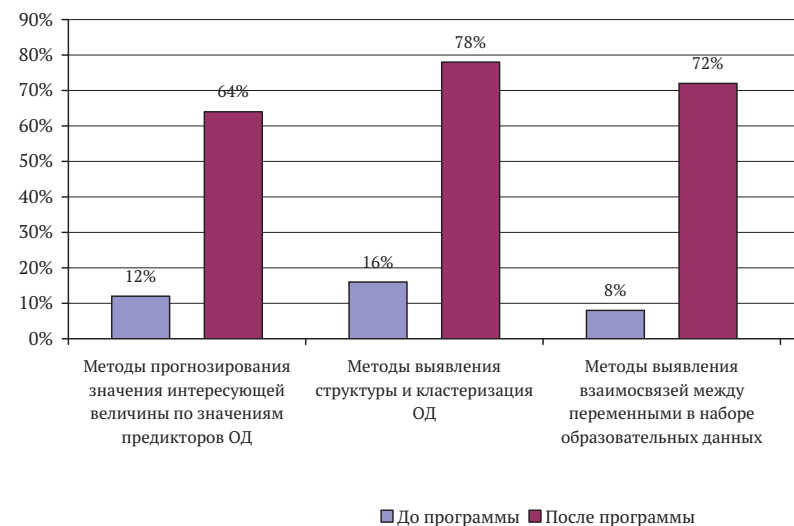
Рис. 1. Динамика развития профессиональных компетенций анализа образовательных данных до и после программы повышения квалификации

Анализ изменения социальной ситуации образовательной деятельности в условиях развития цифровизации показал, что изменяется структура профессиональных компетенций специ-