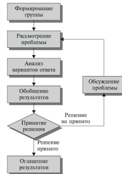
Схема 1. Упрощённая схема подготовки решений

просов для следующего этапа. Количество таких этапов может быть различным.