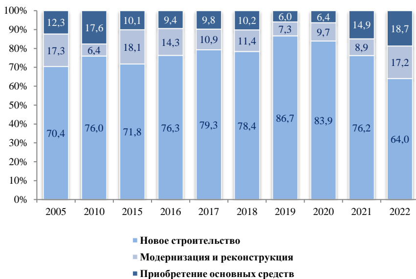
Структура инвестиций по направлениям (без субъектов малого предпринимательства и объема инвестиций, не наблюдаемых прямыми статистическими методами)

По данным выборочного обследования инвестиционной активности организаций, осуществляющих деятельность в сфере добычи полезных ископаемых, обрабатывающей промышленности, обеспечения электрической энергией, газом и паром; кондиционирования воздуха, водоснабжения; водоотведения, организации сбора и утилизации отходов, деятельности по ликвидации загрязнений в 2022 году, одной из популярных целей инвестирования у организаций, как и в предыдущие годы, оставалась замена изношенной техники и оборудования, на что указали 81% респондентов, 64% -