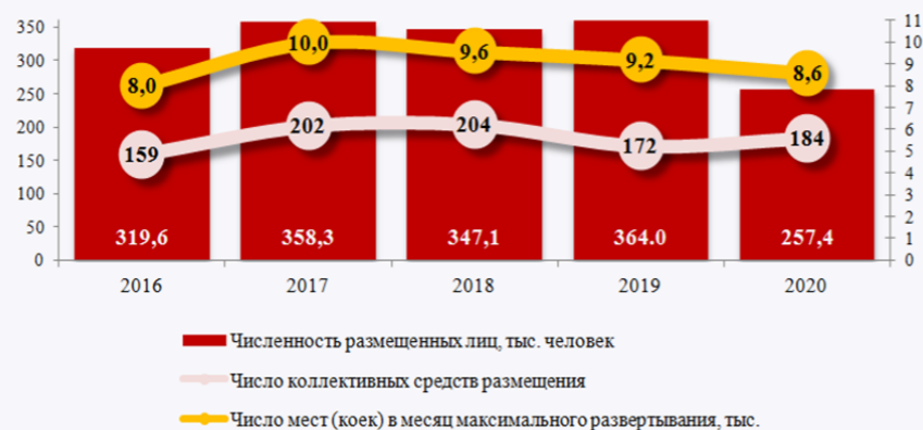
ПОКАЗАТЕЛИ ДЕЯТЕЛЬНОСТИ КОЛЛЕКТИВНЫХ СРЕДСТВ РАЗМЕЩЕНИЯ

В 2020 году коллективные средства размещения получили доход от предоставления услуг в сумме 1697,8 млн. рублей (в 2019г. – 1476,3 млн. рублей).