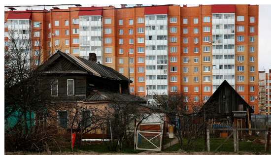
СТРУКТУРА ЖИЛИЩНОГО ФОНДА ОБЛАСТИ ПО ФОРМАМ СОБСТВЕННОСТИ ЖИЛЬЯ

Из общей площади жилищного фонда области 56,7% оборудовано одновременно водопроводом, водоотведением, отоплением, горячим водоснабжением, ваннами (душем), газовыми или напольными элект-