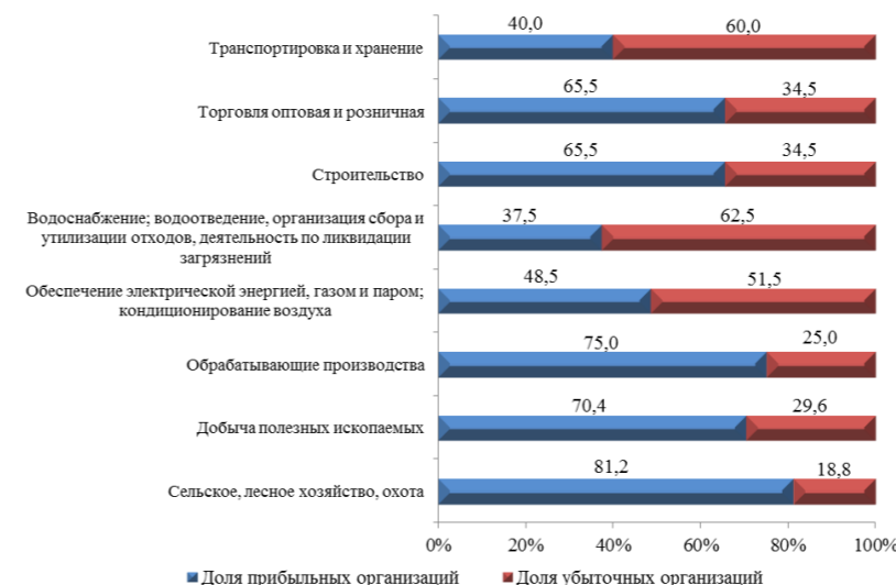
Удельный вес прибыльных и убыточных организаций за 2020 год по видам экономической деятельности

нерентабельными организациями, приходится на такие виды деятельности, как обеспечение электрической энергией, газом и паром; кондиционирование воздуха – 83510 млн. рублей, добыча полезных ископаемых – 1186 млн. рублей, строительство – 623 млн. рублей.