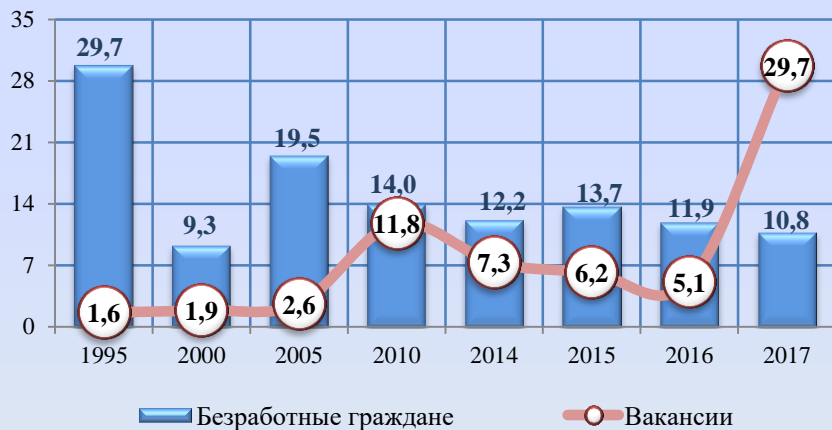
Напряженность на регистрируемом рынке труда Амурской области, на конец года