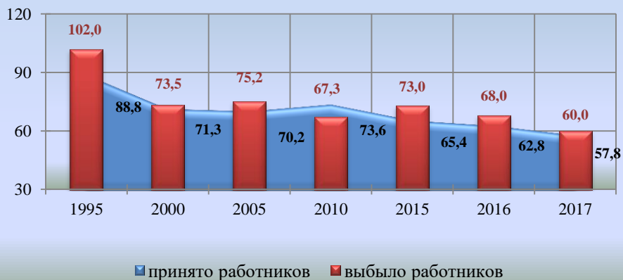
Движение работников предприятий, не относящихся к субъектам малого предпринимательства, тыс. человек