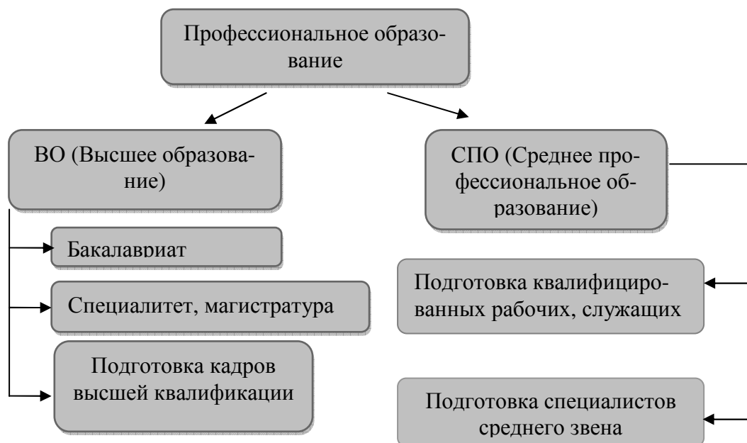
Рисунок 1 – Уровни профессионального образования

В Российской Федерации устанавливаются следующие уровни профессионального образования, которые представлены на рисунке 1.