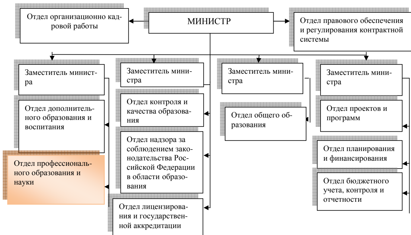
Рисунок 4 – Структура министерства образования и науки Амурской области

зования на территории Амурской области осуществляет отдел профессионального образования и науки.