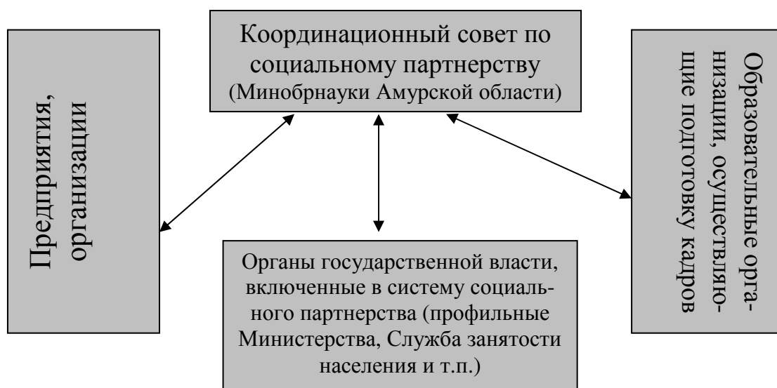
Рисунок 8 – Схема взаимодействия субъектов социального партнерства в сфере подготовки кадров

На рисунке 8 представлена схема Координационного Совета.