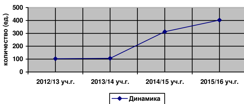
Рисунок 5 – Открытие профильных классов в регионе по учебным годам

Проводит профориентационную работу по направлениям среднего профессионального образования. В организациях общего образования в настоящее время функционируют профильные классы. В 2015/16 уч. году функционировало 403 профильных класса с охватом около 7 тыс. старшеклассников, что составляет 56 % от их общего числа, по направлениям: физико-математическое, естественнонаучное, военное, военно-спортивное и др. Динамика развития профильных классов в общеобразовательных учреждениях представлена на рисунке 5.