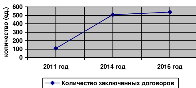
Рисунок 6 – Количество заключенных договоров о сотрудничестве в сфере подготовки кадров

Заключая договоры, работодатели обязались предоставить более 3000 рабочих мест для прохождения обучающимися практики и последующего их трудоустройства.