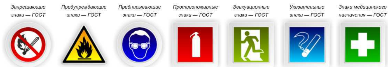
Рисунок 4 – Знаки безопасности