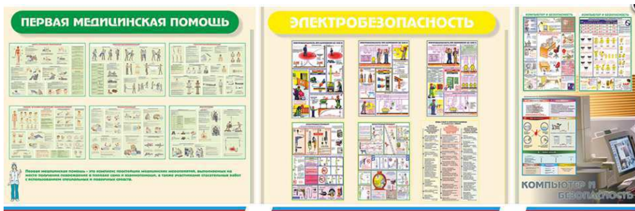
Рисунок 3 – Стенды «первая медицинская помощь», «электробезопасность», «компьютер и безопасность»

Для оснащения уголка по охране труда приобретаем знаки безопасности (рисунок 4) по ГОСТ 12.4.026-2001 [17]: