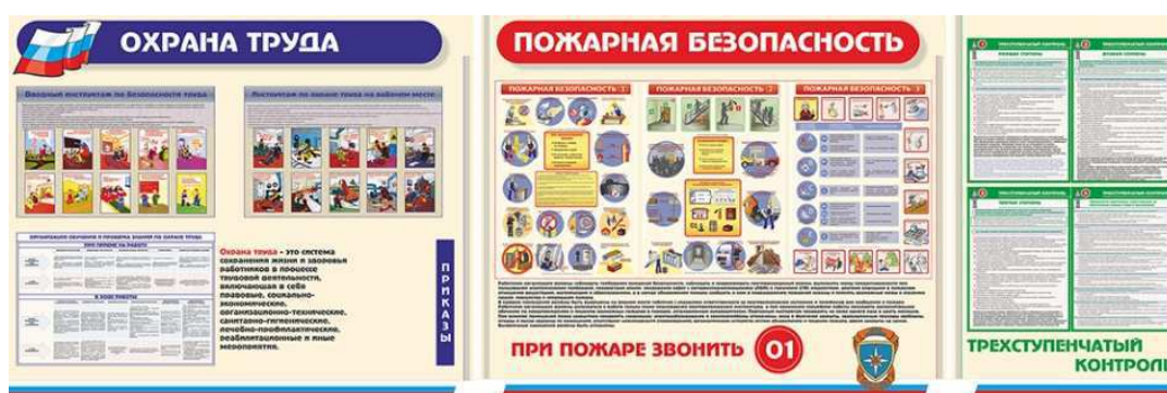
Рисунок 2 – Стенд «охрана труда», «пожарная безопасность», «трехступенчатый контроль»