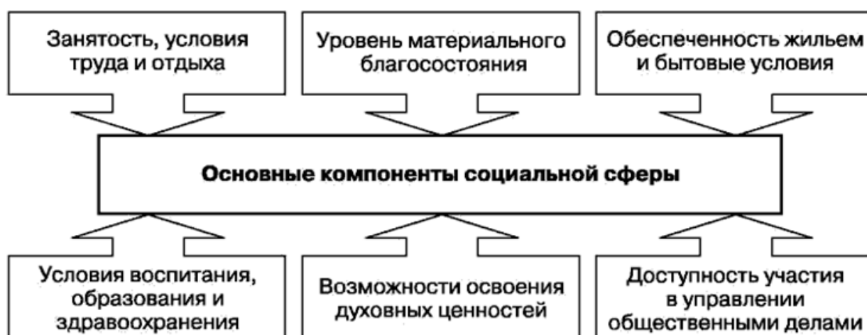
Рисунок 1 – Основные компоненты социальной сферы

Социальная сфера в широком смысле состоит из следующих основных компонентов (рисунок 1).