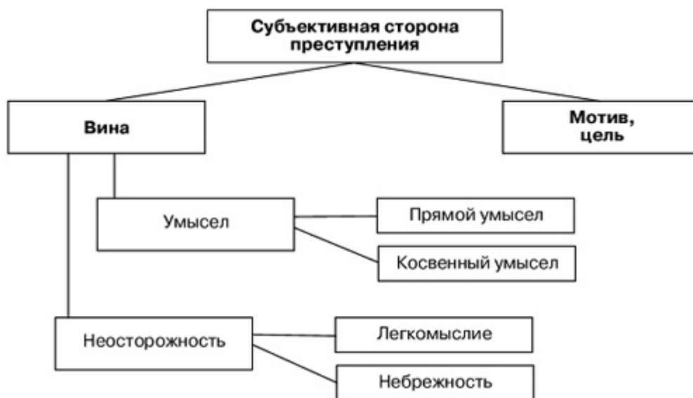
Рис. 6. "Субъективная сторона преступления".

Субъективная сторона - отношение лица к совершаемому им преступлению. То есть, это то какие эмоции вызывает у лица совершаемое им общественно - опасное деяние. (См. рис. 6)