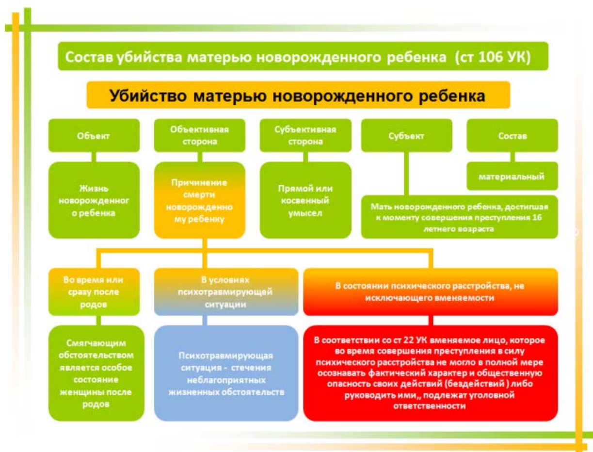
Рис. 1. "Убийство матерью новорождённого ребёнка".

Состав преступления состоит из четырёх элементов, точнее сказать под-систем: объект, объективная сторона, субъект, субъективная сторона. (См. рис. 1)