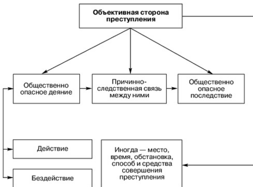
Рис. 3. "Объективная сторона преступления".

Объективной стороной преступления признаётся внешнее проявление конкретного общественно опасного поведения, осуществляемого в определенных условиях, месте, времени и причиняющего вред общественным отношениям. 17 (См. рис. 3)