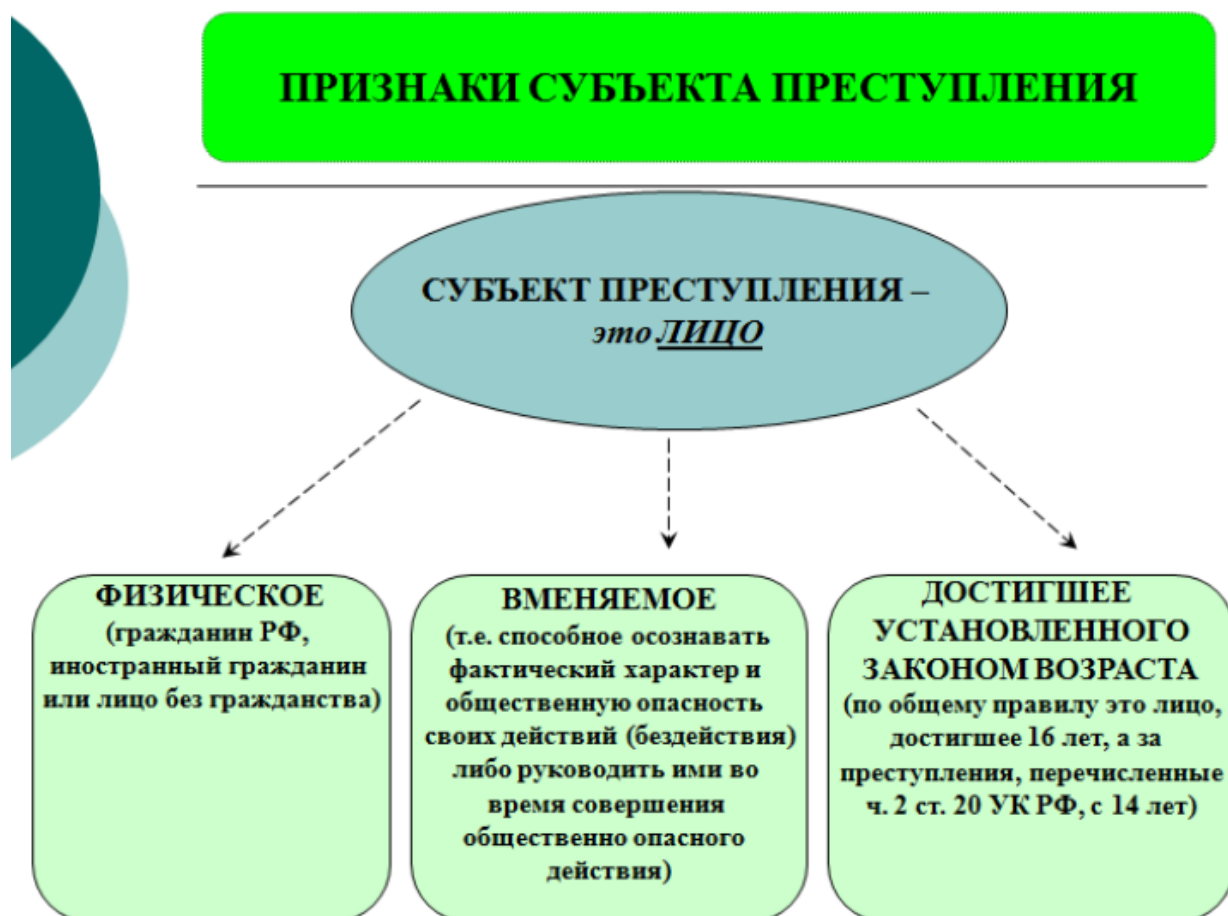
Рис. 4. "Субъект преступления".

Субъект преступления - это лицо, совершившее общественно опасное деяние и способное в соответствии с законом понести за него уголовную ответственность. ( См. рис. 4)