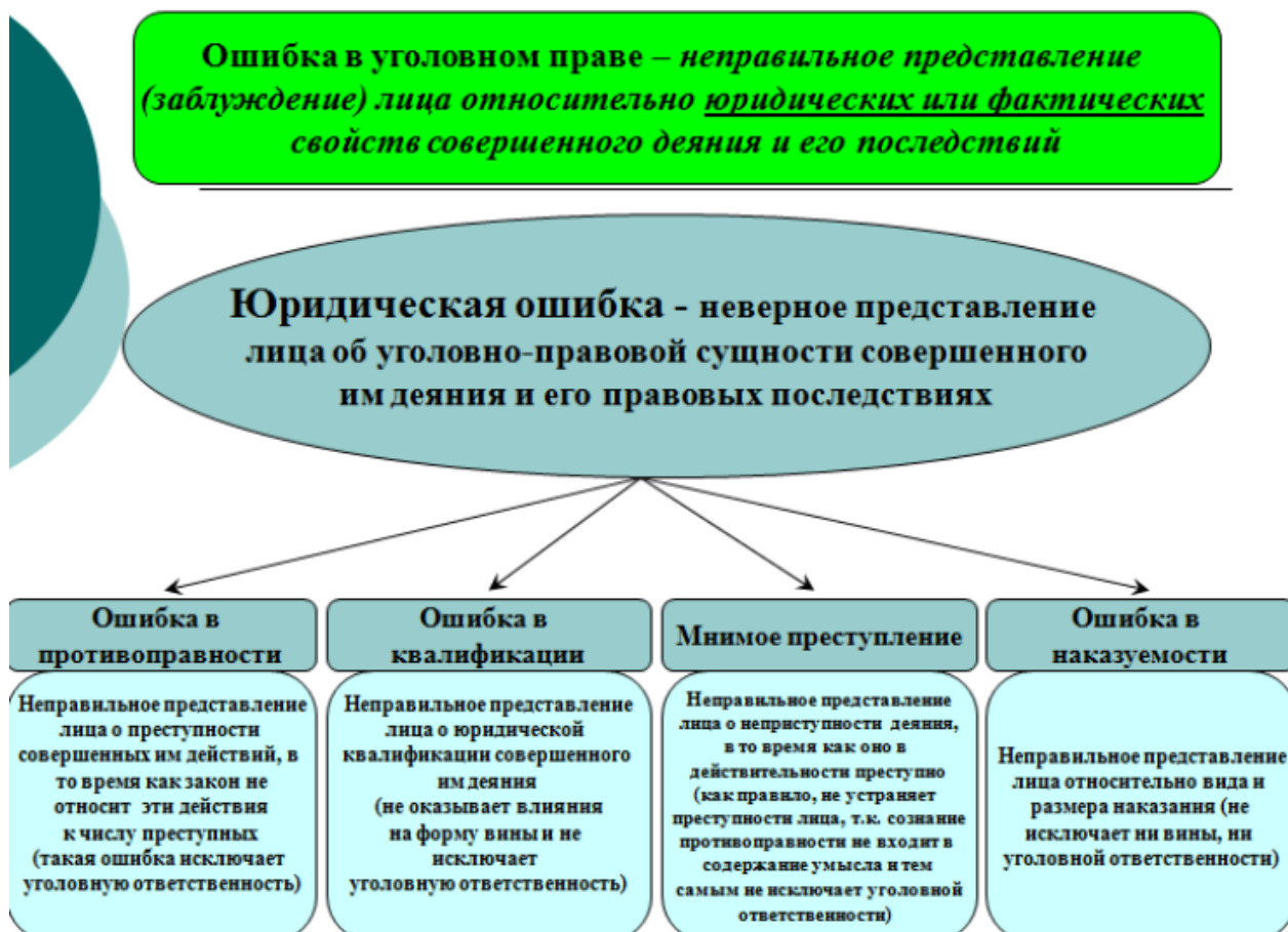
Рис. 7. "Ошибка в уголовном праве".

Ошибка в объекте - это неправильное представление лица о социальной и юридической сущности объекта посягательства. Возможны две разновидности подобной ошибки. Во-первых, так называемая подмена объекта посягательства, которая заключается в том, что субъект преступления ошибочно полагает, будто посягает на один объект, тогда как в действительности ущерб причиняется другому объекту, неоднородному с тем, который охватывался умыслом виновного". Например, мать, пытающаяся убить своего новорожденного ребенка, на самом деле причиняет ему тяжкий вред здоровью. При наличии такого рода ошибки преступление должно квалифицироваться в зависимости от направленности умысла. Однако нельзя считаться с тем, что объект, охватываемый умыслом виновного, фактически не потерпел ущерба. Чтобы привести в соответствие эти два обстоятельства (направленность умысла и причинение вреда другому объекту, а не тому, на который субъективно было направлено деяние), при