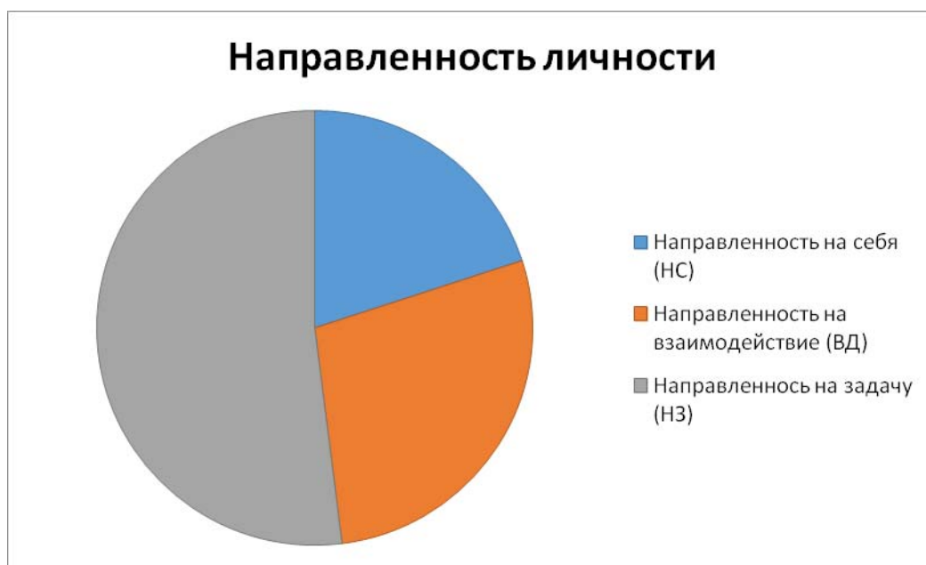
Рисунок 1 – Показатели уровней направленности личности студентов

К людям с направленностью на себя (НС) часто присущи такие черты как ответственность, властность, агрессивность в достижении своего статуса, уверенность в себе, целеустремлённость, склонность к соперничеству, эгоистичность, стремление к одиночеству, организованность, умение сконцентрироваться на важной проблеме, раздражительность, тревожность и др.