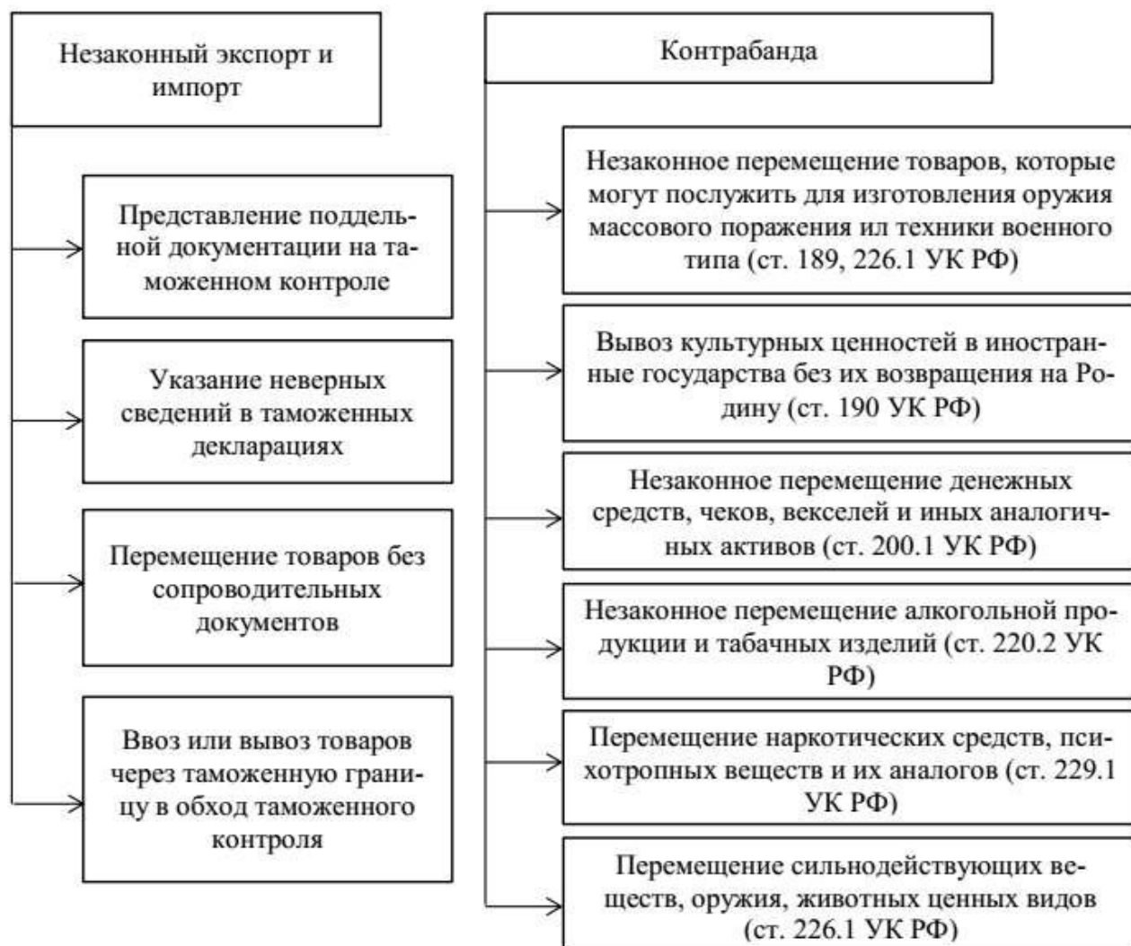
Рисунок 1 – Отличие незаконного экспорта и импорта от контрабанды 6

Характеристика указанных процессов представлена на рисунке 1.