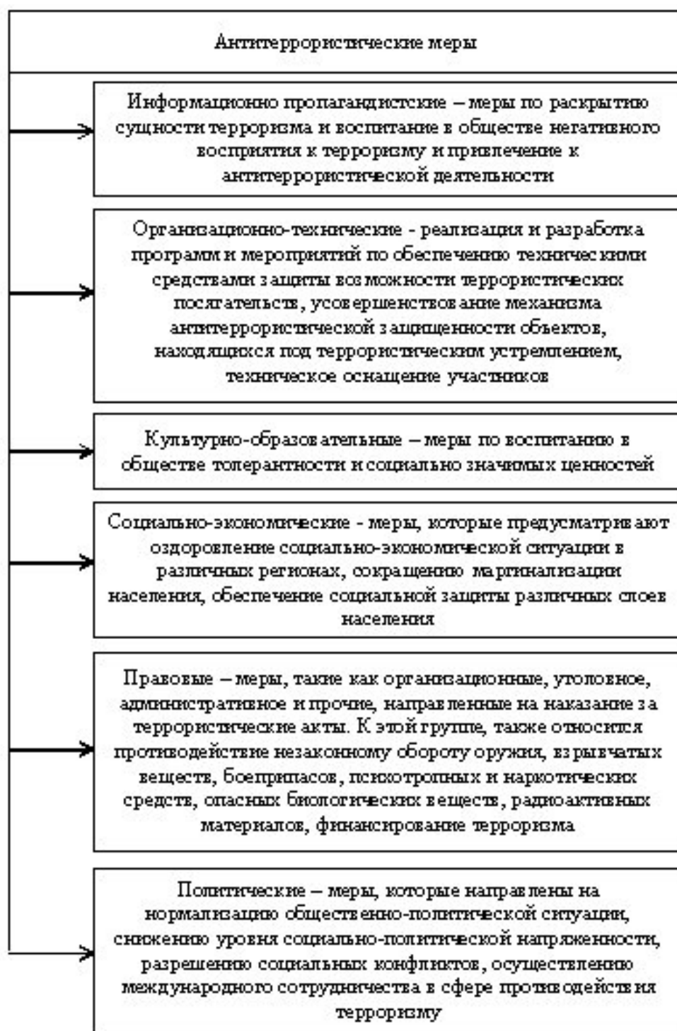
Рисунок 4 – Характеристика антитеррористических мер, реализуемых на территории Российской Федерации 26

- бюджетная составляющая (терроризм негативно влияет на бюджетную систему, в результате необходимости осуществления расходов на возмещение