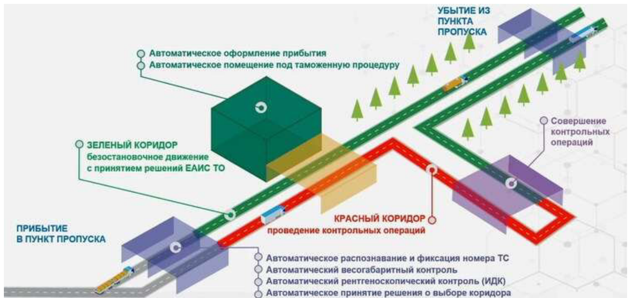
Рисунок А.1 – Модель интеллектуального пункта пропуска