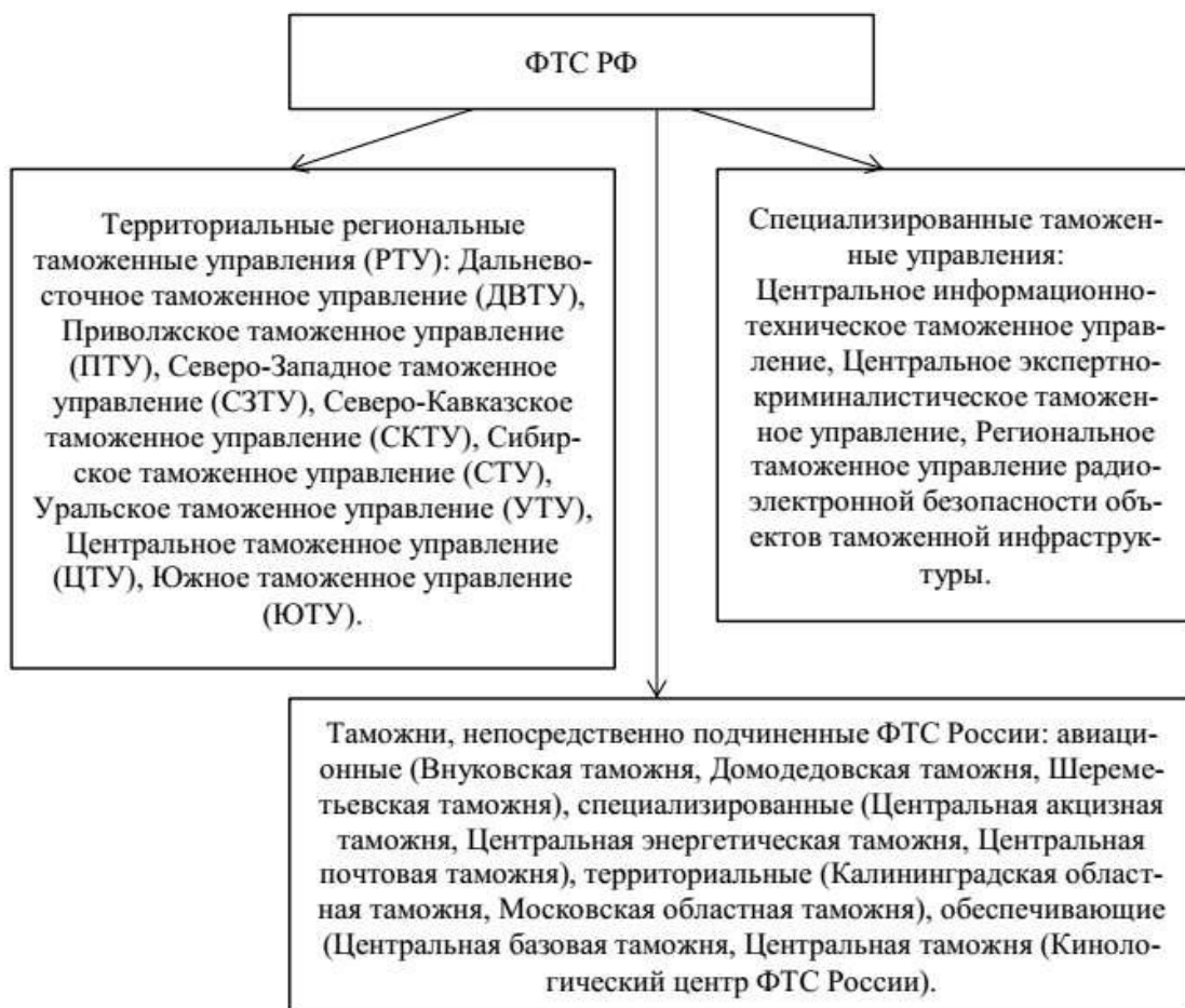
Рисунок 6 – Структура ФТС РФ

Все представленных элементы структуры ФТС РФ наделены определенными функциями и полномочиями, при этом основной целью их деятельности, является контроль над соблюдением норм таможенного законодательства.