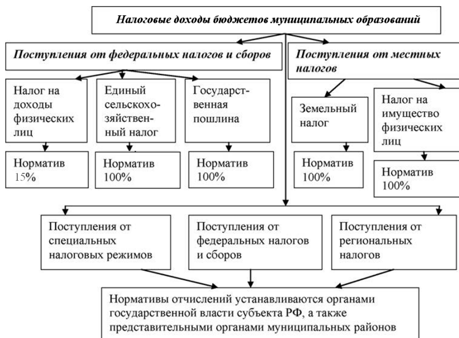
Рисунок 1 - Налоговые доходы местного бюджета

Доходы бюджетов муниципального образования регулируют казначейство, Администрация муниципального района, налоговая служба, Управление финансами и другие федеральные и муниципальные органы. Налоговые доходы местного бюджета представлены на рисунке 1.