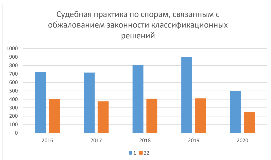
Рисунок 5 - Судебная практика по спорам, связанным с обжалованием законности классификационных решений: 1 – всего рассмотрено дел, 2 – рассмотрено в пользу таможенных органов

Увеличение количества дел в судебном производстве шло параллельно с увеличением количества рассматриваемых дел в суде, что можно наблюдать на рисунке 2. Стоит отметить, тенденцию к снижению удельного веса судебных дел, которые были рассмотрены в пользу таможенных органов. Еще в 2016 г. доля таких составила чуть больше половины, то в 2017 г. – 52, а в 2018 г. – 50,7 %, в 2019 – 62,3%, в 2020 количество значительно дел сократилось на фоне пандемии и закрытия границ. На основе вышеизложенных фактов, мы можем сделать вывод, об актуальности работы по изменению негативной судебной практики.