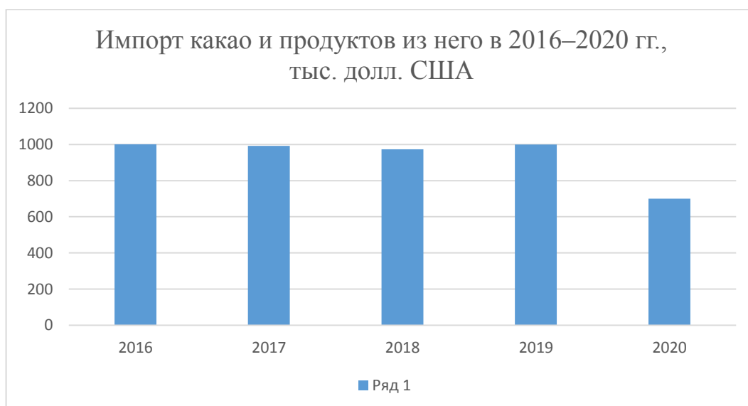
Рисунок 2 – Импорт какао и продуктов из него в 2016–2020 гг., в тыс. долл. США

На данном рисунке наблюдается значительное снижение объемов экспорта и импорта товаров группы 18 ТН ВЭД ЕАЭС в 2017 году. Это может быть связано с введенными в отношении России санкций, которые сильно сократили количество партнеров. Резкое падение цен на какао-бобы на товарной бирже также повлияло на объемы импорта и экспорта.