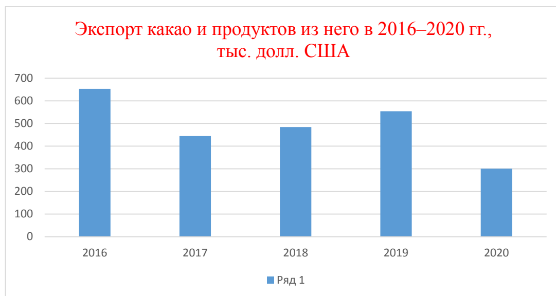
Рисунок 1 - Экспорт какао и продуктов из него в 2016–2020 гг., в тыс. долл. США

Анализируя данные таблицы, можно сделать вывод, что импорт какао и продуктов из него существенно преобладает над экспортом какао и какао-продуктов из него, что, в частности, может быть связано с погодными условиями, в регионах, где производится данный продукт. Поэтому у государств-членов ЕАЭС, появляется нужда в закупке огромных партий сырья для производства готовых товаров на своей территории. (шоколад, какао-пасту, конфеты и т.д.).