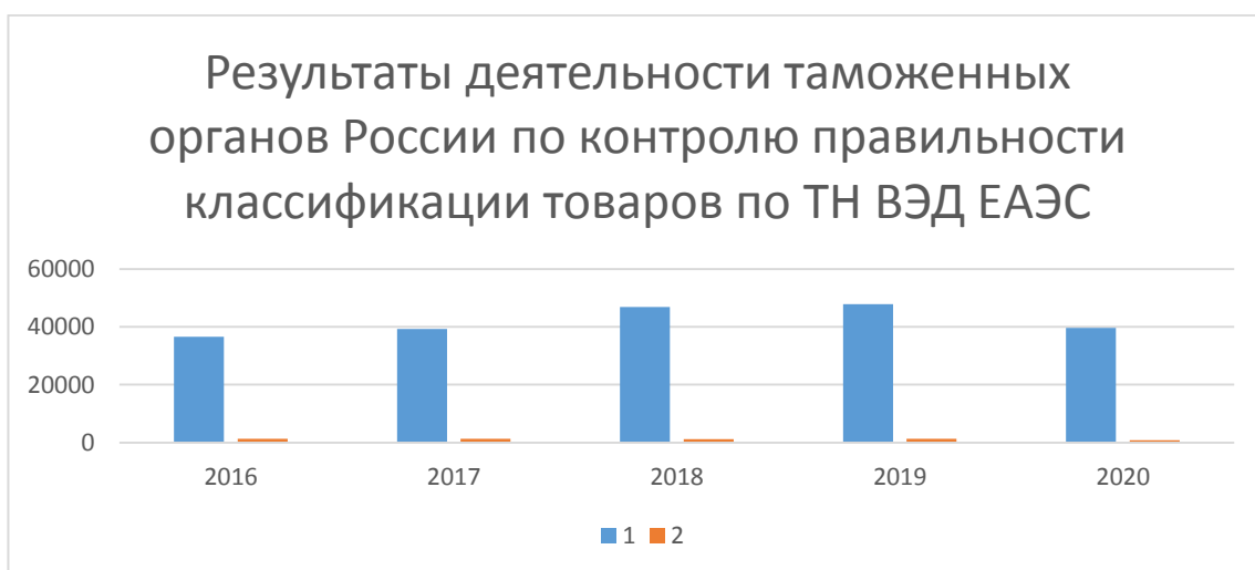
Рисунок 4 - Результаты деятельности таможенных органов России по контролю правильности классификации товаров по ТН ВЭД ЕАЭС: 1 – принято решений, 2 – количество дел в судебном производстве

Начиная с 2016 года по сегодняшний день, в производстве находилось более тысячи судебных дел, в которых оспаривалось законность вынесения решения таможенным органом по классификации товаров по ТН ВЭД ЕАЭС. (рисунок 4).