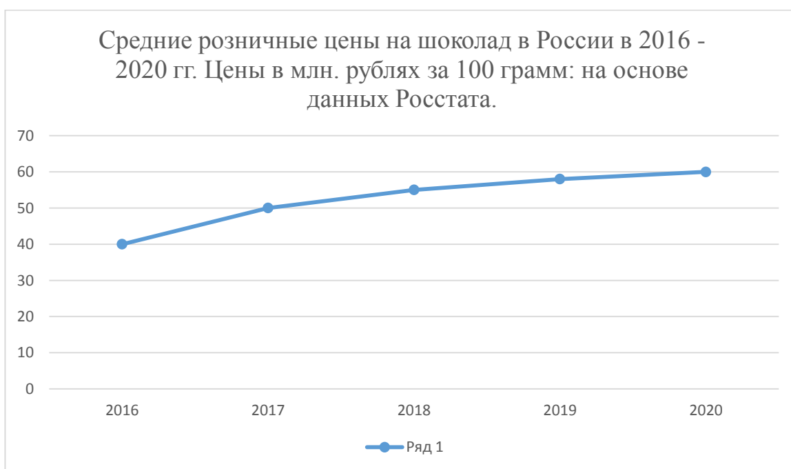
Рисунок 3 - Средние розничные цены на шоколад в России в 2016 - 2020 гг. Цены в рублях за 100 грамм: на основе данных Росстата.

Розничная цена на шоколад в России в условиях пандемии COVID-19, удорожания какао-сырья и ослабления курса рубля в 2021 году существенно увеличилась. Какао опережает, драгоценные металлы по темпам роста цен 2021 года. С 2020 года — биржевая стоимость какао прибавила 19%,