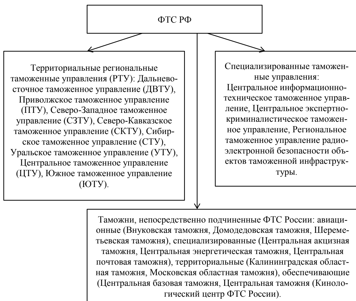
Рисунок 2 – Структура ФТС РФ

В состав ФТС РФ входят: территориальные региональные (РТУ) и специализированные таможенные управления, а также таможни и таможенные посты (рисунок 2).