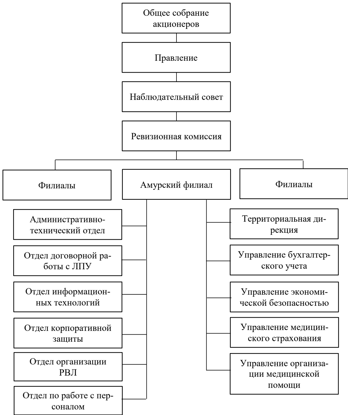
Рисунок 6 - Организационная структура Амурского филиала АО «Страхования компания «Согаз-Мед»

размер уставного капитала и другие вопросы.