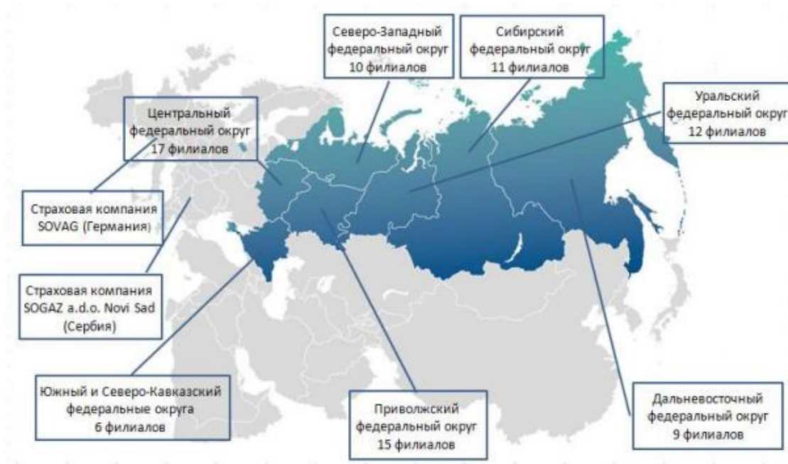
Рисунок 5 - Региональная сеть АО «Страховая компания «СОГАЗ-Мед»

Региональная сеть СОГАЗ-Мед насчитывает более 1 000 подразделений на территории 56 субъектов РФ и г. Байконур.