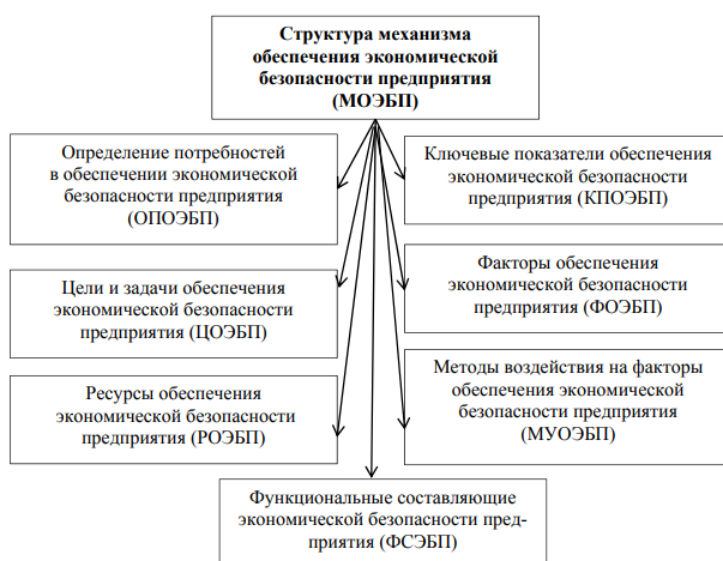
Рисунок 3 - Общая структура механизма обеспечения экономической безопасности предприятия

Система управления экономической безопасностью страховой компании основывается на конкретном механизме, особенностью которого выступает его комплексный характер, предполагающий совокупность процессов управленческого, правового, организационного, информационного, экономического и иного характера. Общая структура механизма обеспечения экономической безопасности предприятия представлена на рисунке 3.