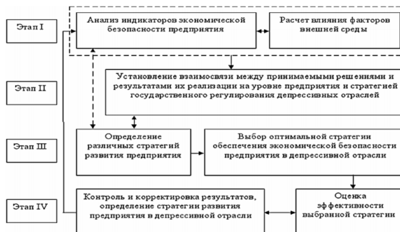
Рисунок 2 - Этапы формирования стратегии экономической безопасности предприятия

- стратегия возмещения нанесенного ущерба.