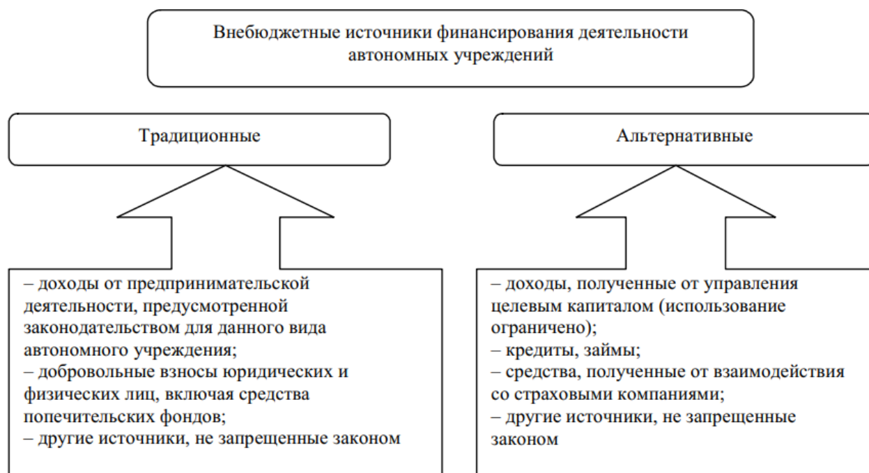
Рисунок 2 – Внебюджетные источники финансирования автономных учреждений

Собственные и заемные источники финансирования деятельности бюджетных учреждений относятся к внебюджетным источникам (рисунок 2).