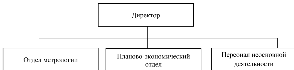
Рисунок 3 – Структура управления ФБУ «Амурский ЦСМ»

Руководство деятельностью ФБУ «Амурский ЦСМ» осуществляется директором, основной функцией которого является контроль над общей деятельностью учреждения и ее результатами. Организационная структура управления ФБУ «Амурский ЦСМ» представлена на рисунке 3.