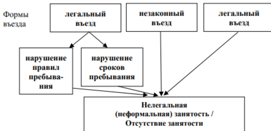
Рисунок 2 - Таким образом, структура незаконной (нелегальной) миграции

Таким образом, структура незаконной (нелегальной) миграции может быть представлена в виде схемы (рисунок 2). Следует отметить, что в основном, процессы незаконной миграции имеют возвратный характер и обусловлены, прежде всего, нелегальным трудоустройством в иностранном государстве.