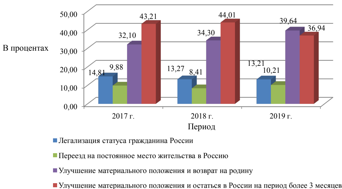
Рисунок 4 - Структура показателей фактов незаконной миграции на территории г. Благовещенска Амурской области за 2017 – 2019 гг. по причинам незаконной миграции

Структура показателей фактов незаконной миграции на территории г. Благовещенска Амурской области за 2017 – 2019 гг. по причинам незаконной миграции представлена на рисунке 4.