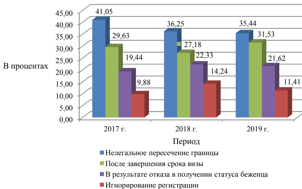
Рисунок 3 - Структура показателей фактов незаконной миграции на территории г. Благовещенска Амурской области за 2017 – 2019 гг. по формам незаконной миграции

Структура показателей фактов незаконной миграции на территории г. Благовещенска Амурской области за 2017 – 2019 гг. по формам незаконной миграции представлена на рисунке 3.