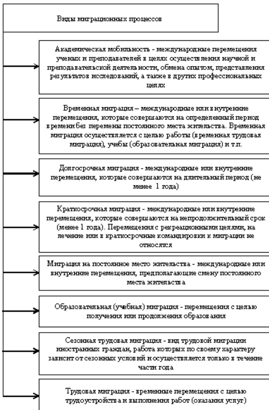
Рисунок 1 – Классификация миграционных процессов

следует рассмотреть термин «миграция населения». Миграцией признается любое перемещение населения из одной местности в другую, которой выступает, муниципальное образование, субъект РФ, или страна. Концепцией государственной миграционной политики РФ на период до 2025 года представлена классификация миграционных процессов (рисунок 1).