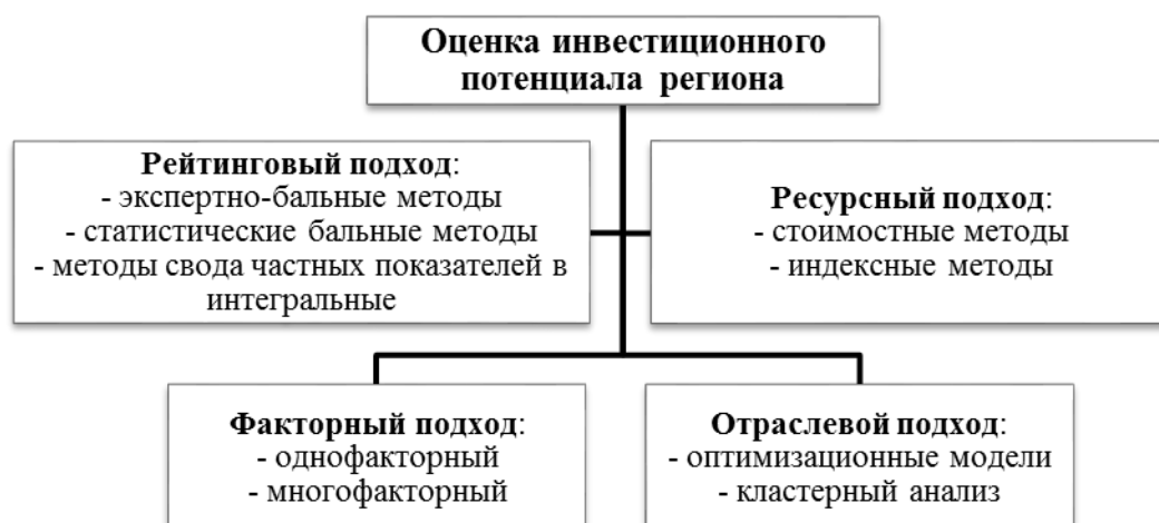
Рисунок 1 – Основные подходы к оценке инвестиционного потенциала региона

В экономической литературе выделяют большое количество подходов к определению и оценке инвестиционного потенциала. Их можно классифицировать по различным определяющим факторам: уникальность набора показателей, экономический уровень рассматриваемой системы и т. д. Каждый подход к определению и оценке инвестиционного потенциала содержит определенный набор методов и инструментов, основные из которых представлены на рисунке 1 13 .