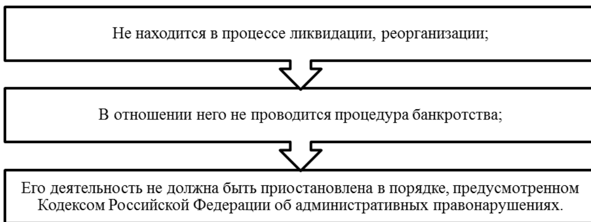
Рисунок 6 – Требования к претендентам на получение Патронажного сертификата Губернатора Амурской области

Претендент по получение Патронажного сертификата должен соответствовать следующим требованиям, которые представлены на рисунке 6.