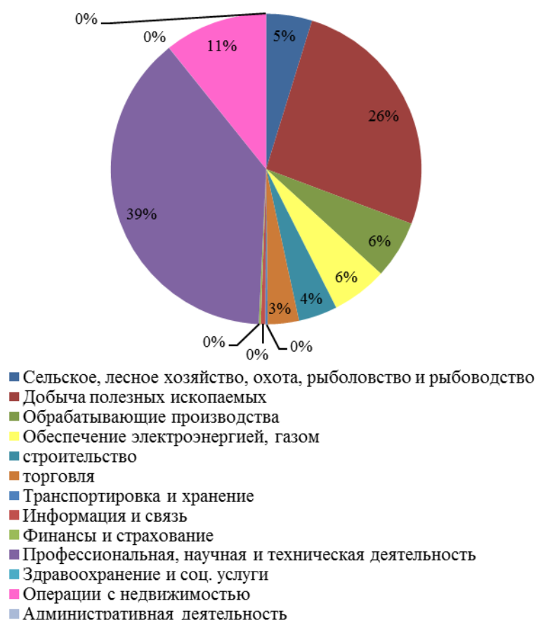
Рисунок 4 - Финансовые вложения по видам экономической деятельности за 2018 год

Так, на основании данных таблицы 12, можно сделать вывод о том, что добыча полезных ископаемых являются лидирующим видом экономической деятельности в Амурской области по объемам финансовых вложений. Для более углубленного исследования инвестиционного потенциала Амурской области составим диаграмму финансовых вложений по видам экономической деятельности за 2018 год, она представлена на рисунке 4 48 .