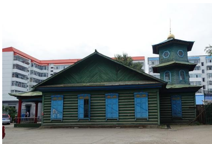
Рисунок 6 – Общий вид мечети г. Хэйхэ

В г. Хэйхэ также имеются специальные халяльные (соответствующие нормам ислама, все то, что разрешено и допустимо в исламе) рестораны с широким ассортиментом китайских и уйгурских блюд. Эти блюда готовятся из сортов мяса животных, которые не противоречат исламским пищевым запретам.