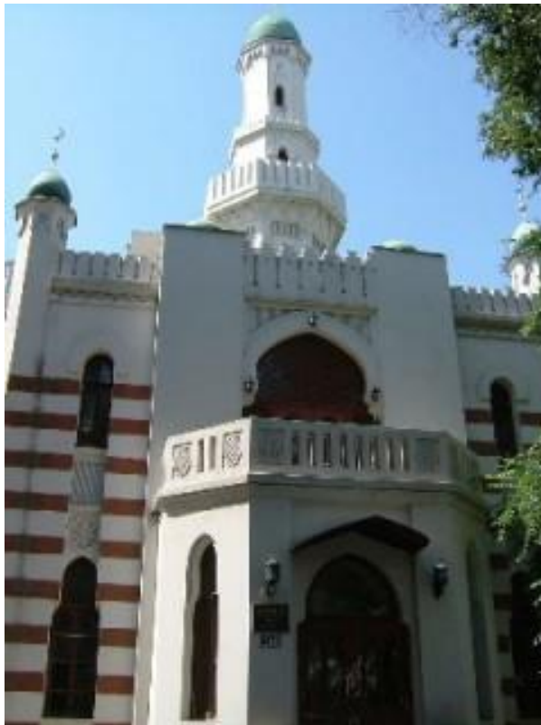
Рисунок 2 – Татарская мечеть г. Харбина, современный вид

мечеть передали китайским мусульманам, ее отреставрировали (рисунок 2). Мечеть расположена на современной улице Тунцзянце в районе Даоли. Несмотря на то, что здание мечети до сих пор сохранилось, но своих прямых функций она не выполняет (рисунок 2).