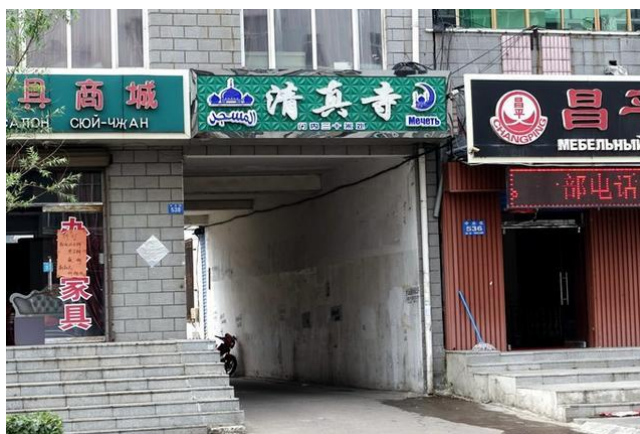
Рисунок 4 – Указание на мечеть со стороны центральной улицы г. Хэйхэ

В приграничном с Россией китайском г. Хэйхэ, находящемся на территории провинции Хэйлунцзян мечеть была построена более 100 лет назад, поэтому имеет не только религиозную, но и историко-культурную ценность (рисунок 4) 60 .