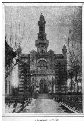
Рисунок 1 – Татарская мечеть г. Харбина, 1937 г.

Постройка состоит из двух этажей и трёхъярусного минарета. Общая площадь почти 300 квадратных метров. Вмещает 500-600 человек. Мечеть строилась и существовала на пожертвования. Мусульманская татарская община Харбина была активной, вела разнообразную социо-культурную работу. Мечеть получила название Татарской или Турецкой. При мечети действовали школа, несколько приютов для детей, инвалидов, нищих, пожилых людей. Известны имена первых служителей исламского культа в мечети – это Г. Селихметов (до 1926 г.) и М. Хасбиуллин (до 1944 г.). Гиниятулла Селихметов (Ахмеди) стал имамом общины в 1907 г., ему было 18 лет, он окончил стерлитамакское медресе. После его смерти в 1926 г. имамом стал Мунир Хасбиуллин, при нем Татарская мечеть была наконец-то достроена. Строительство растянулось на 15 лет по финансовым причинам. Служба в мечети осуществлялась на двух языках – китайском и татарском.