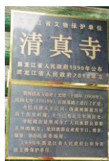
Рисунок 5 – Надпись на стене мечети, с указанием исторических данных

В настоящее время рядом с мечетью отстроено новое здание, мечеть находится на реконструкции.