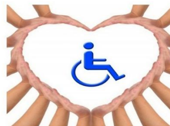
Рисунок К.1 – Информационный буклет для инвалидов. Сторона 1

..... ▶ Создание достойных условий жизни инвалидам — одна из первоочередных задач государства в социальной сфере жизнедеятельности общества!