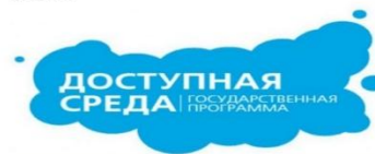
Рисунок К.2 – Информационный буклет для инвалидов. Страница 2

2.2 Оплата проезда инвалидам, а также лицам их сопровождающим, авиационным транспортом к месту лечения и обратно.