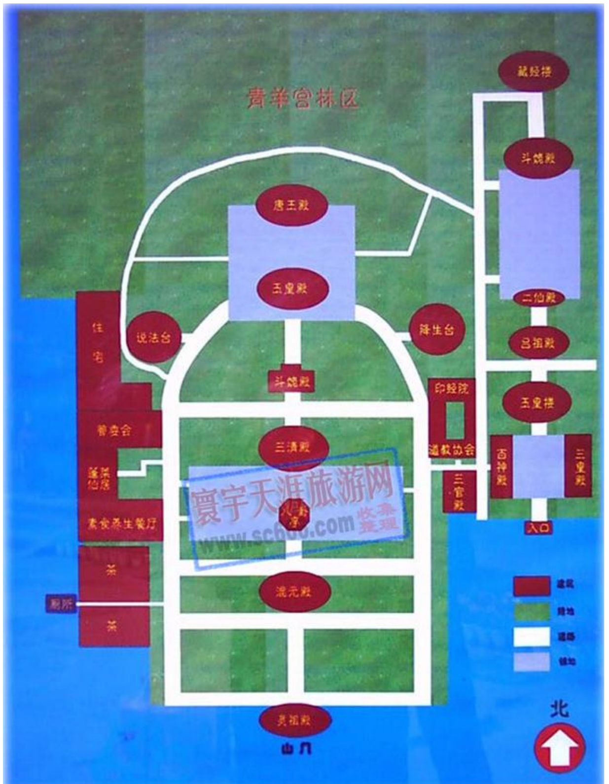
Рисунок А. 1 – храм Цинъянгун