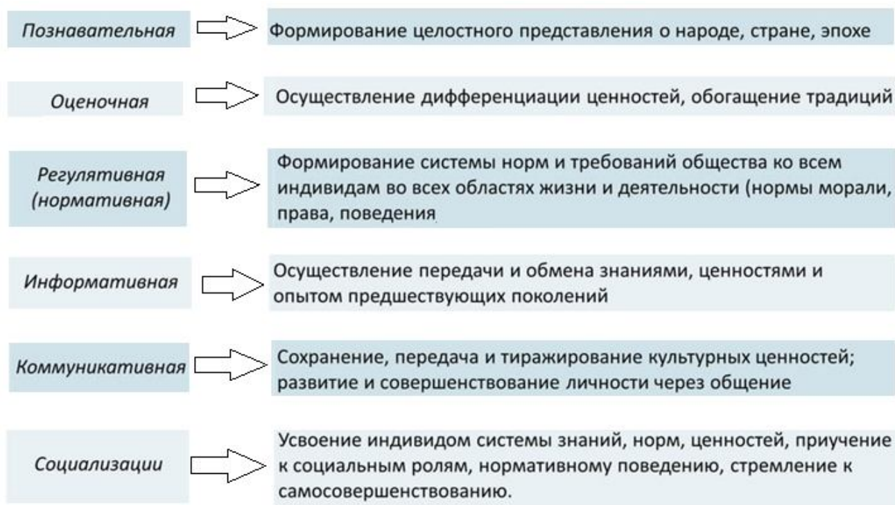
Рис. 6. Основные функции культуры.

Интегративная функция культуры. Освоение культуры создает у людей – членовтого или иного общества чувство общности, принадлежности к одной нации, народу, религии, группе и т. д. Культура сплачивает людей, интегрирует их, обеспечивает целостность общества.