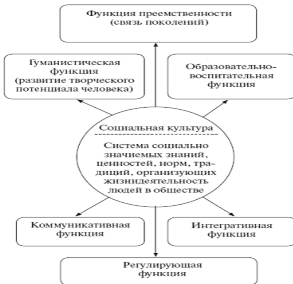
Рис. 10. Функции социальной культуры.

Например, снобизм как черта элитарной культуры проявляется в том, что социальные верхи, вырабатывая новые стандарты, образцы, ценности, стремятся постоянно дистанцироваться от средних слоев и низов. Снобизм является своеобразной защитой от проникновения в состав элиты людей с более низким социальным статусом. Культура постоянно очерчивает социальные границы между общностями. Так, «женские» и «мужские» нормы и ценности проводят невидимую границу между полами (что можно мужчинам и нельзя женщинам, к чему должны стремиться мужчины и женщины и т.д.). Так же культура обозначает социальные границы между поколениями, этносами, классами, горожанами и сельскими жителями, гражданами европейского сообщества и других стран.