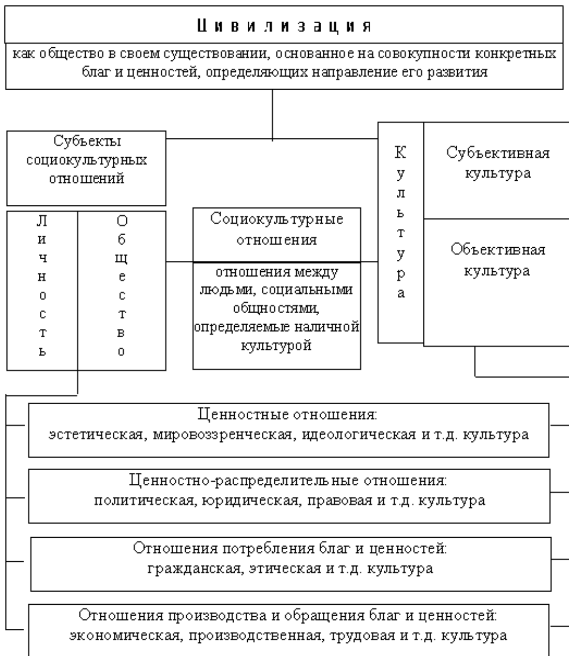
Рис. 5. Цивилизация, общество, культура (авт. И.И. Санжаревский).

салии. Это понятие ввел в научный оборот американский социолог и этнограф Дж. Мердок, который выделил универсалии – общие для всех культур элементы: язык, религию, мифологию, возрастную градацию, календарь, нательные украшения, спорт, игры, гадание, ухаживание, сексуальные ограничения, похоронные ритуалы и т.д.