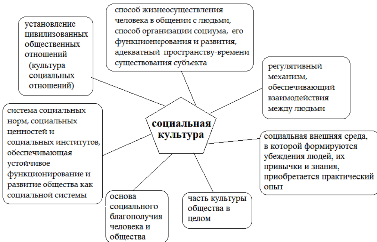
Рис. 8. Аспекты рассмотрения термина «социальная культура».

Итак, можно говорить о различных аспектах социальной культуры как категории научных теоретико-методологических изысканий (рис. 8, 9), каждый из которых учитывает специфическую проблематику и расставляет акценты как в аспекте научной профилизации, так и в содержательном плане.