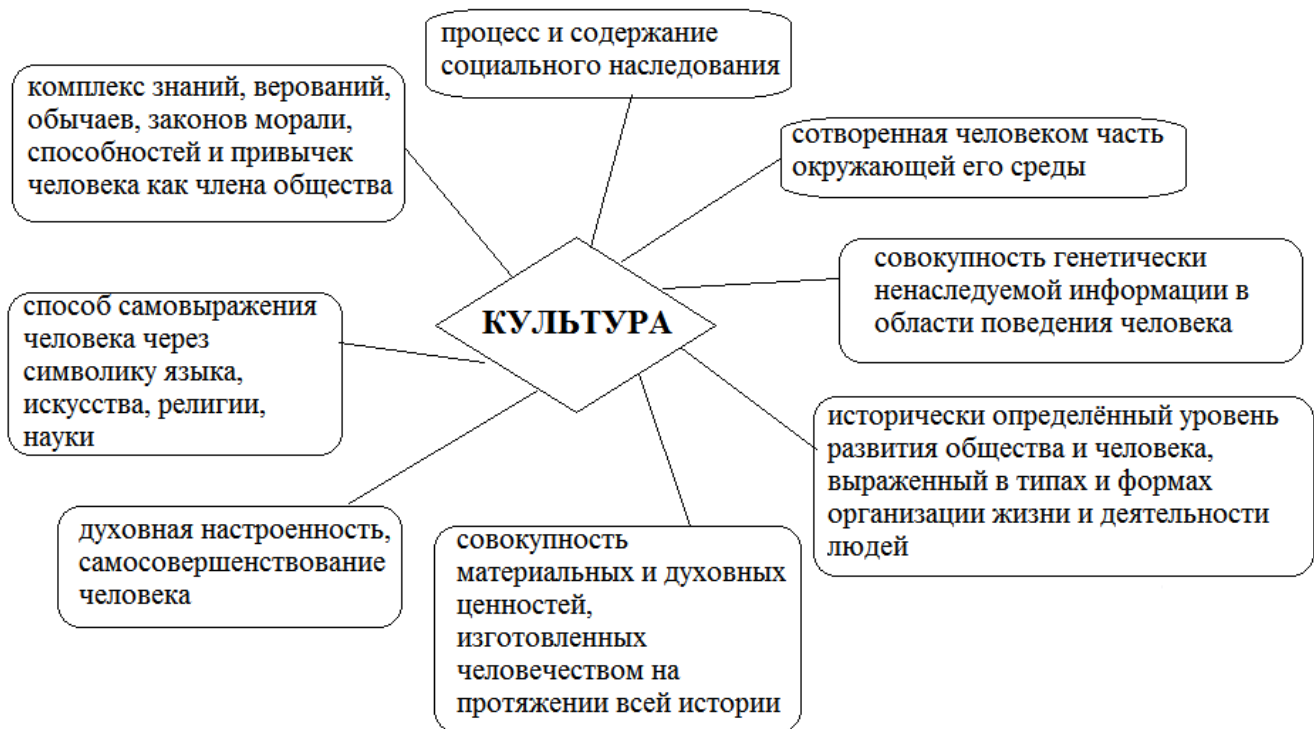
Рис. 1. Многообразие аспектов трактования термина «культура»

Принципиально важно различать образы культуры, возникающие в контексте технократического, сциентистского сознания, с одной стороны, и гуманитарного – с другой. В первом случае, культура выступает как некая система, объективный предмет, обладающий своей структурой, элементами и требующий изучения научными методами.