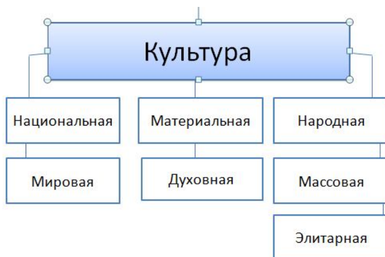
Рис. 2. Условное деление культуры по видам (по С. Череновой).

Многогранность и многоаспектность культуры обуславливает многообразие ее видов . Культуру обычно подразделяют на мировую и национальную, материальную и духовную, народную, массовую и элитарную, хотя это деление и условно (рис. 2).