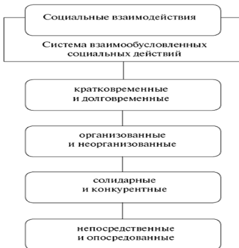
Рис. 7. Социальные взаимодействия.

Социальное взаимодействие основано на социальных статусах и ролях.