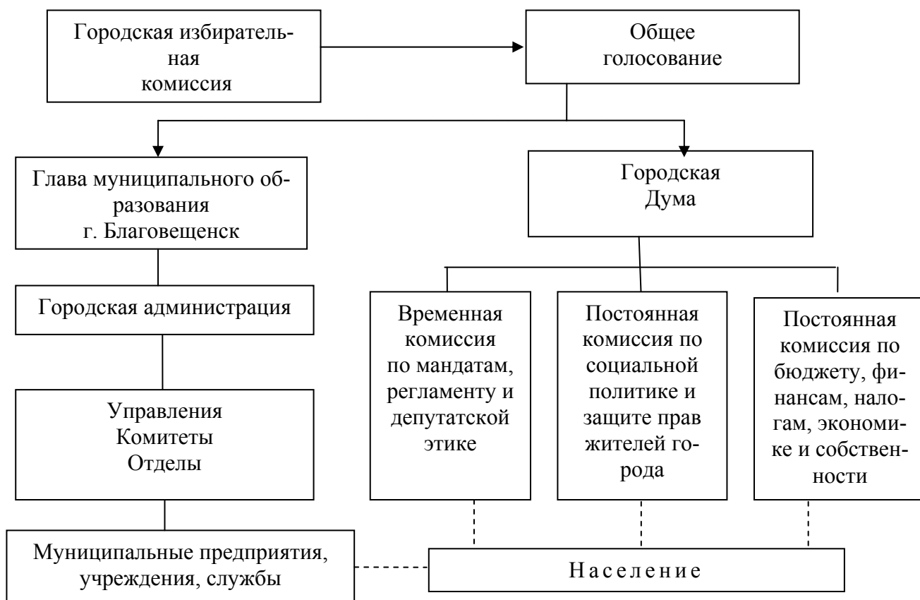
Рис. 3 – Современное городское общественное самоуправление Благовещенска

В настоящее время глава городской администрации и депутаты городской Думы г. Благовещенска избираются сроком на 4 года.